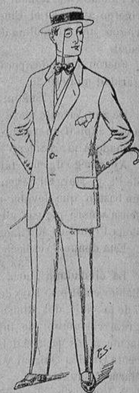
Trajes de lanilla, che- viot, etc. De ptas. 17'50 a 70

Ropas confeccionadas para CABALLERO, SEÑORA, NIÑO y NIÑA