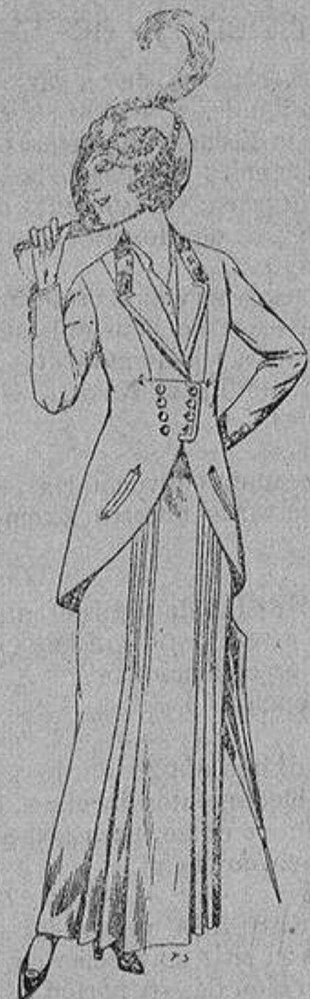
Trajes de lana ne- gra, azul y color pa- ra señora A ptas. 80

Madrid * Barcelona * Almería * Bilbao * Cádiz * Car- tagena * Gijón * Granada * Málaga * Palma de Mallorca Santander * Sevilla * Valencia * Valladolid y Zaragoza