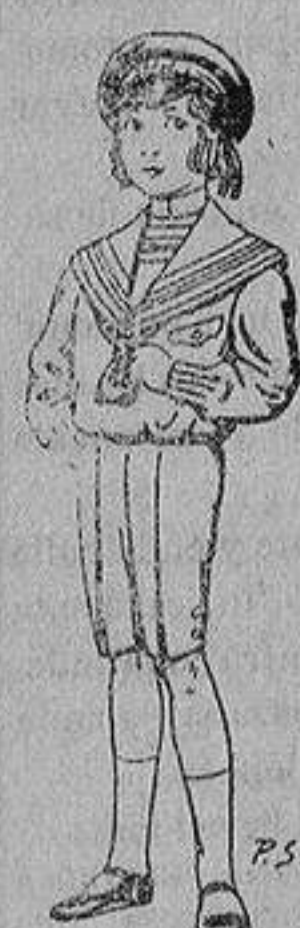
Trajes de lanilla, vicuña ó jerga, para ni- ños de 4 a 9 años De ptas. 6 á 31