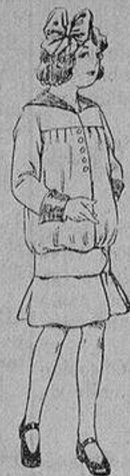
Vestidos lanilla para niñas de 4 a 12 años De ptas. 12 a 20