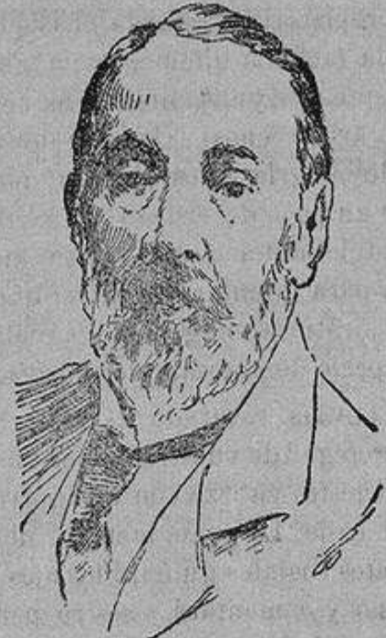
EL CONDE WITTE ilustre político y exministro ruso que acaba de fallecer en Petrogrado