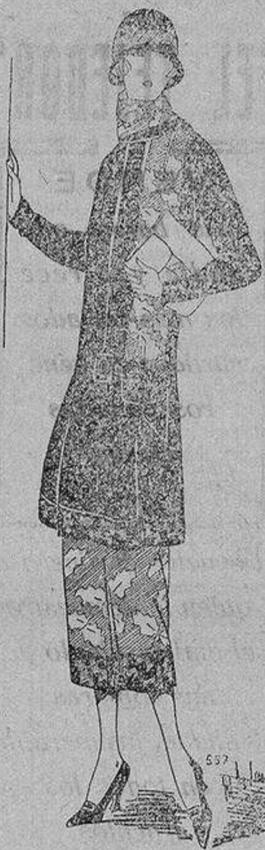
Traje tailleur en reps «tête de nègre», tejido de dibujos color escama y oro pálido.