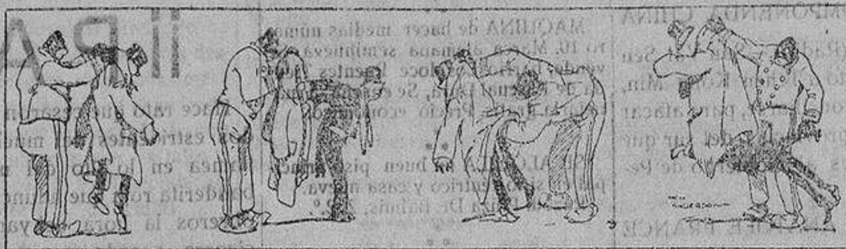
(Historia sin palabras) de «Judge», Nueva York.