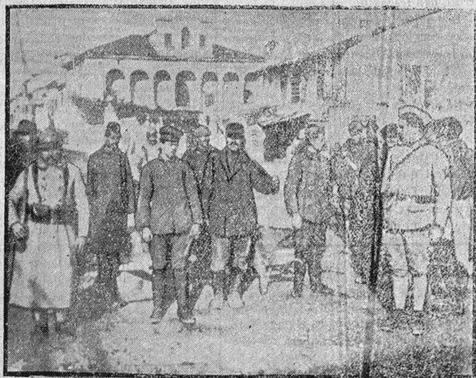
Prisioneros alemanes y austriacos trabajando en Italia Foto Información