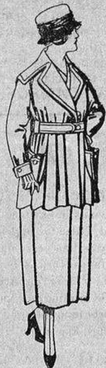
Paletots felpa de seda, diferentes colores, de ptas. 60 a 65.