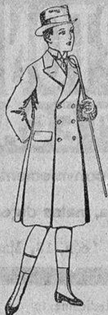
Gabanes de patén para niños de 4 a 9 años, de ptas. 16 a 50.