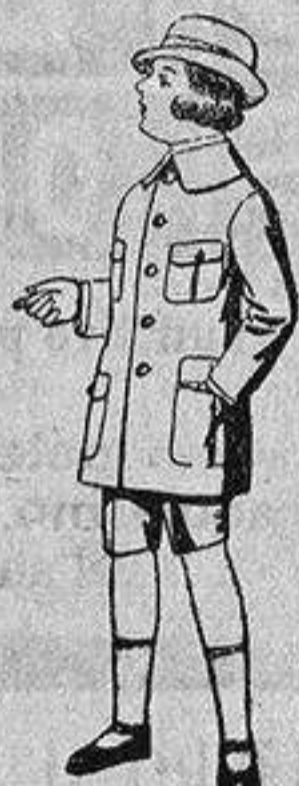
Trajes de patén modelo «Sport», para niños de 4 a 9 años.