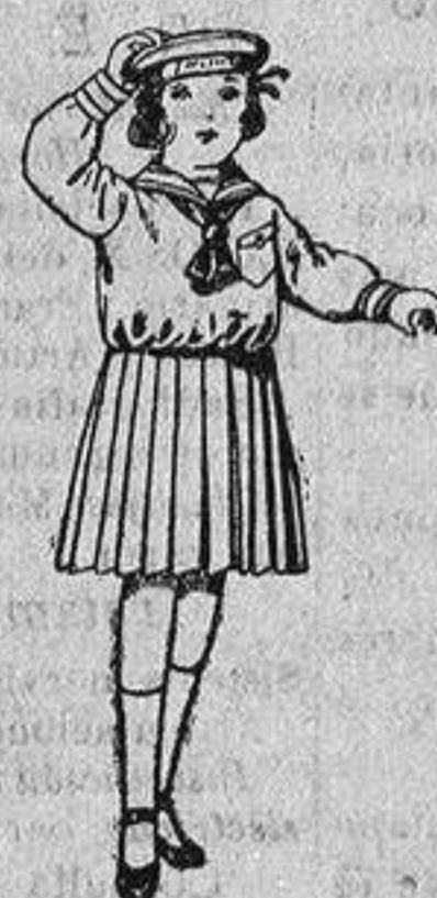
Trajes de marinera de sarga inglesa azul, para niños de 4 a 9 años, de ptas. 30 a 38