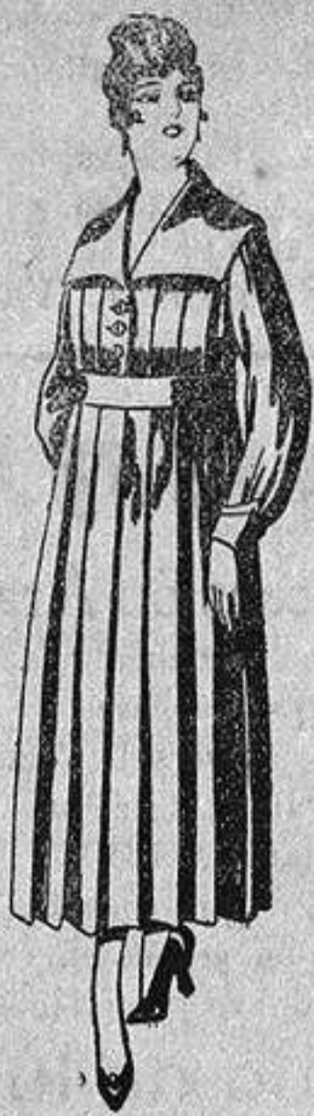
Batas de lanilla diferentes colores, a pesetas, 25.

Madrid, Barcelona, Alicante, Almería, Bilbao, Cádiz, Cartagena, Gijón, Granada, Málaga, Palma de Mallorca, Santander, Sevilla, Valencia, Valladolid y Zaragoza.