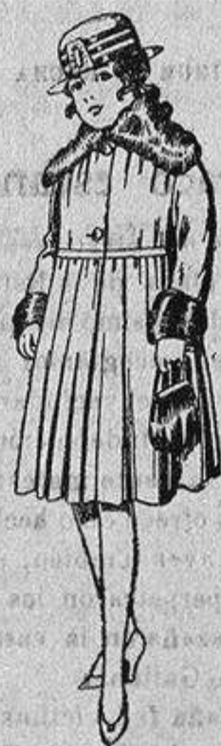
Abrigos de terciopelo de lana, pañete, gamuza, etc.; cuello y bocamangas piel, para niñas de 4 a 9 años, de pesetas 28 a 48