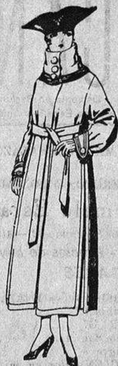
Abrigos de pañete, colores azul, beige y café, de ptas 65 a 85