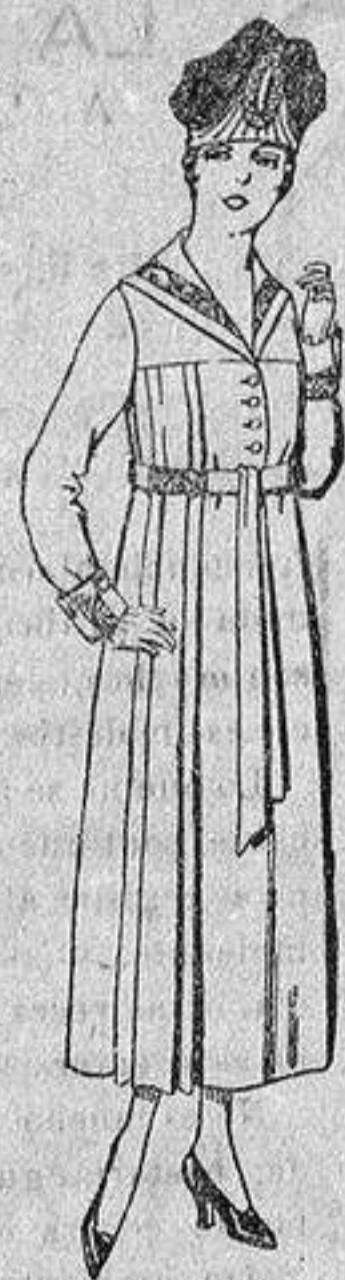
Vestidos de sarga inglesa, en negro, azul y color, bordados, de de ptas. 60 a 70