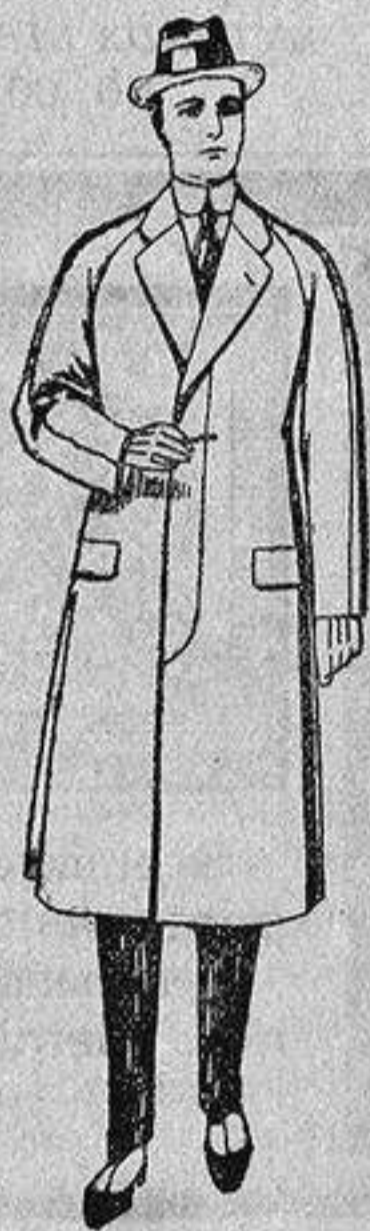
Gabanes de patén, melton o cheviot, con forro de seda, satén o escocés, de ptas. 50 a 100