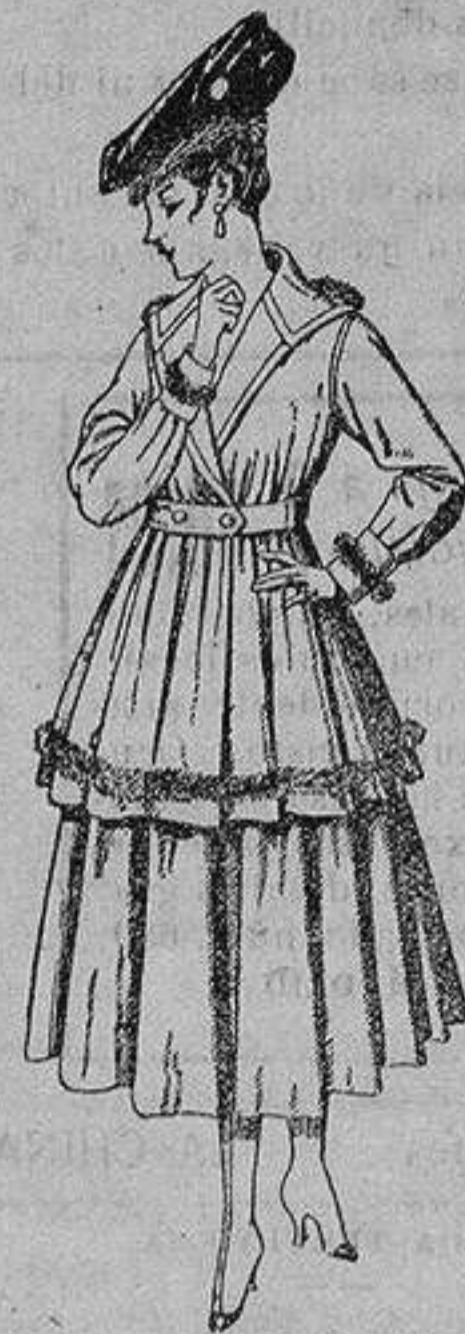
Traje de punto, en color para señora. De ptas. 100 a 130