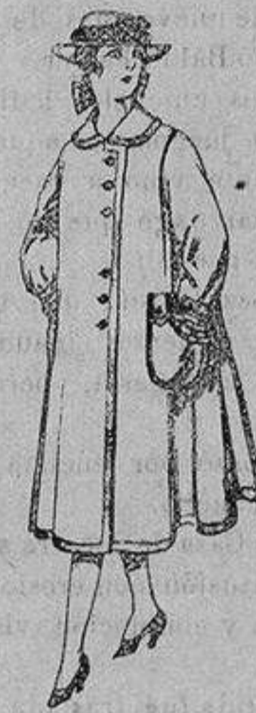
Abrigos de lana para jovencitas de 11 a 15 años De ptas. 35 a 40