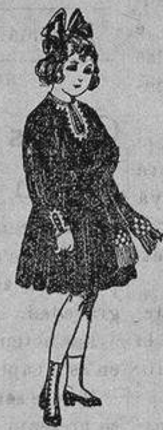
Vestidos de lanilla, para niñas de 4 a 9 años De ptas. 18 a 34.

Precio Fijo - Ventas al contado Pídase el Catálogo General