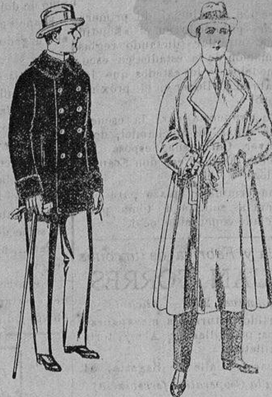
Pelizas de ratina con cuello del mismo género y con astrakan De ptas. 16 a 90 Gabanes impermeabilizados, con cinturón color beige De ptas. 43 a 110