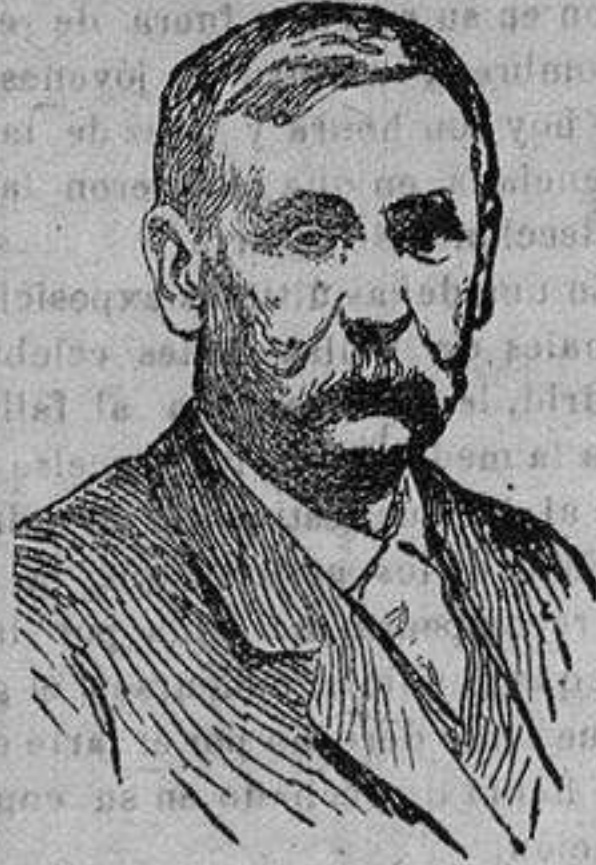
D. BENITO PÉREZ GALDÓS

Respecto a la solvencia de la nación francesa, si nunca creímos que pudiera ponerse en tela de juicio, mucho menos hoy que el resultado de la guerra en lo referente a ese particular está completamente descontado, cosa que no ocurriría hace un año, porque a nadie puede ofrecer la menor duda que con los desarrollos actuales de la campaña, Francia se encamina a la victoria; pero aun no consiguiéndola de un modo radical y definitivo, es absolutamente seguro que ni será aniquilada ni su integridad territorial corre el menor riesgo.