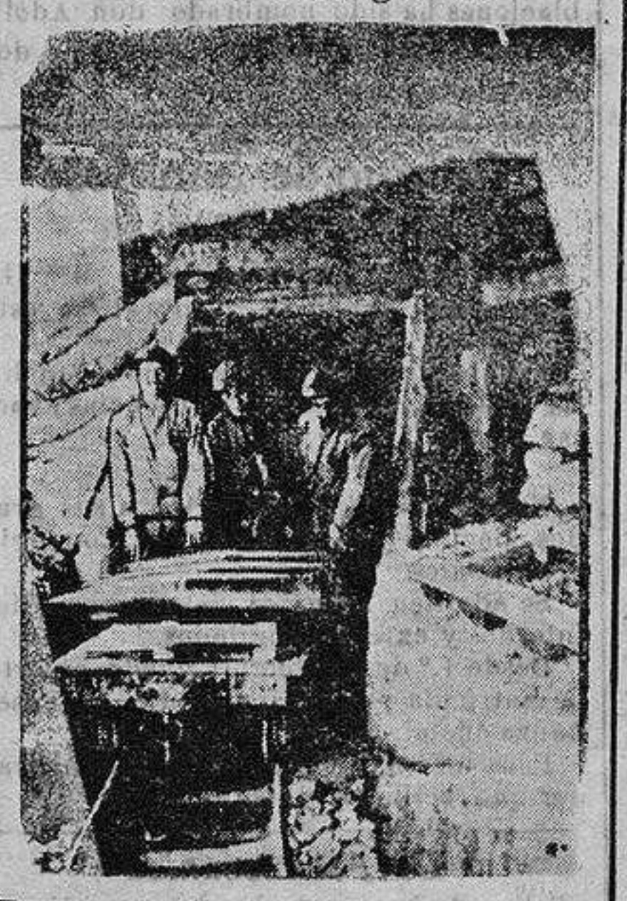
Transporte de obuses.