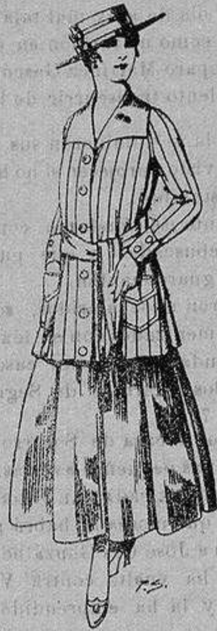
Paletot de tricof de seda colores lisos A ptas. 39