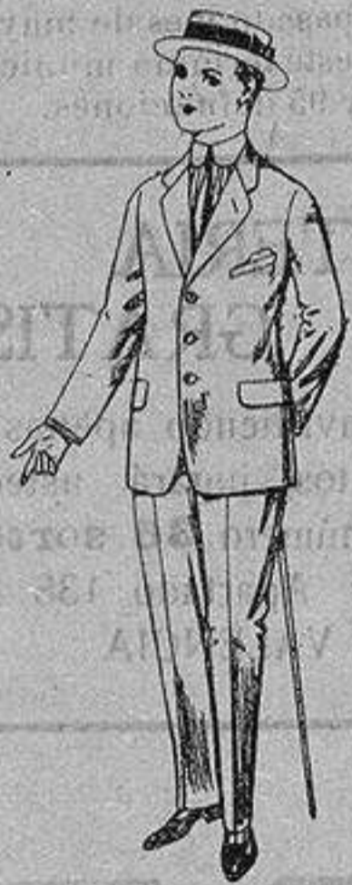
Trajes de lanilla, vicuña, etc. para juvenitos de 15 a 16 años. De ptas. 17 a 48

Precio Fijo - Ventas al contado Pídase el Catálogo General