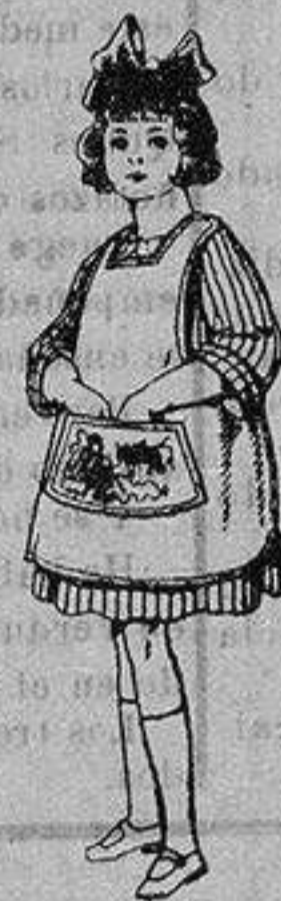
Delantal de dril color bedge De ptas. 3 a 7