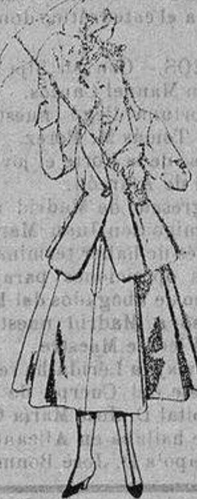
Trajes de lanilla negra azul y color, para jovencitas de 13 a 16 años. De ptas. 50 a 55