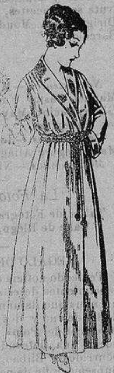
Bata crespón colores varios, cuello y boca-manga seda. De ptas. 15 a 20