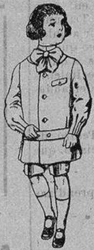
Trajes de lanilla en colores para niños de 4 a 9 años. De ptas. 9 a 18