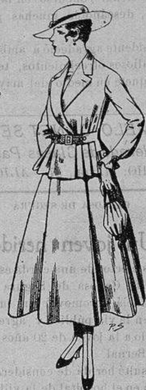
Trajes de lanilla para Señora A ptas. 70