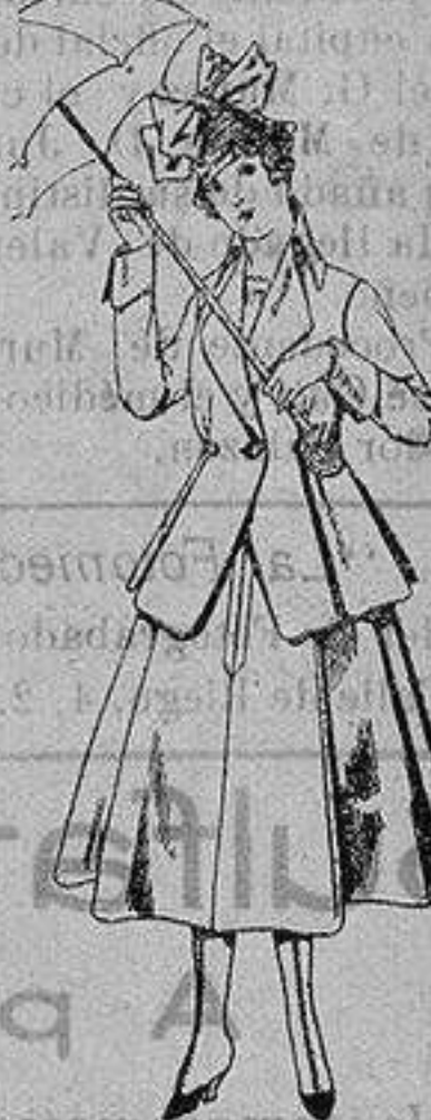
Trajes de lanilla para jovencitas de 13 a 16 años De ptas. 53 a 55

Camisería, Géneros de Punto, Corbatería, Guantería, Sombrerería, Zapatería, Paraguas, Bastones y Artículos de Viaje.