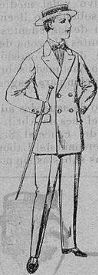
Trajes de lanilla, para jovencitos de 10 a 16 años. De ptas. 17 a 48