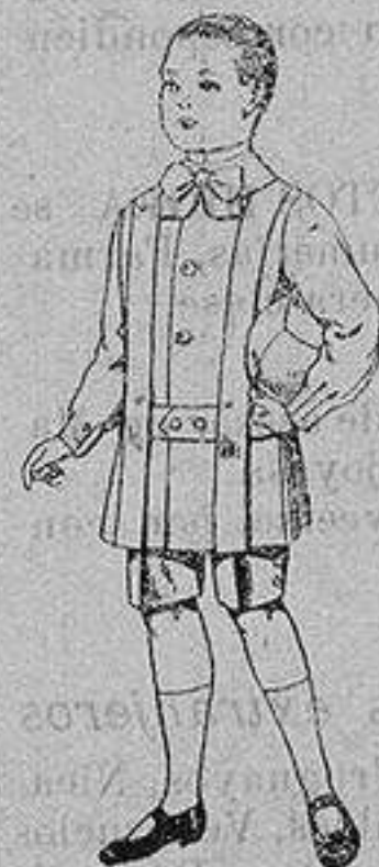
Trajes de lanilla para niños de 4 a 9 años De ptas. 12 a 31