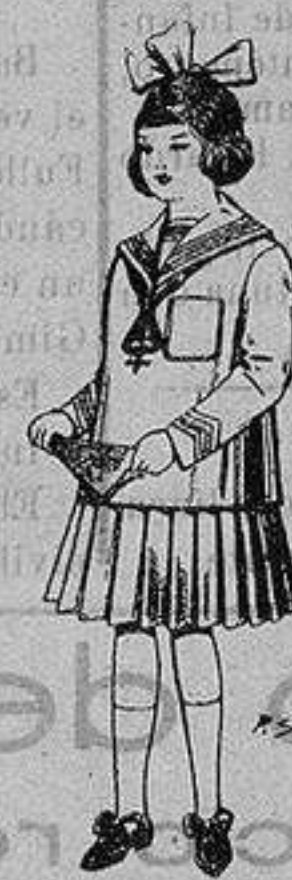
Trajes de lanilla para niñas de 4 a 12 años De ptas. 32 a 40