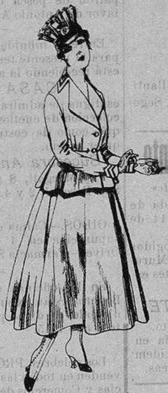
Trajes de lanilla para Señora A ptas. 80