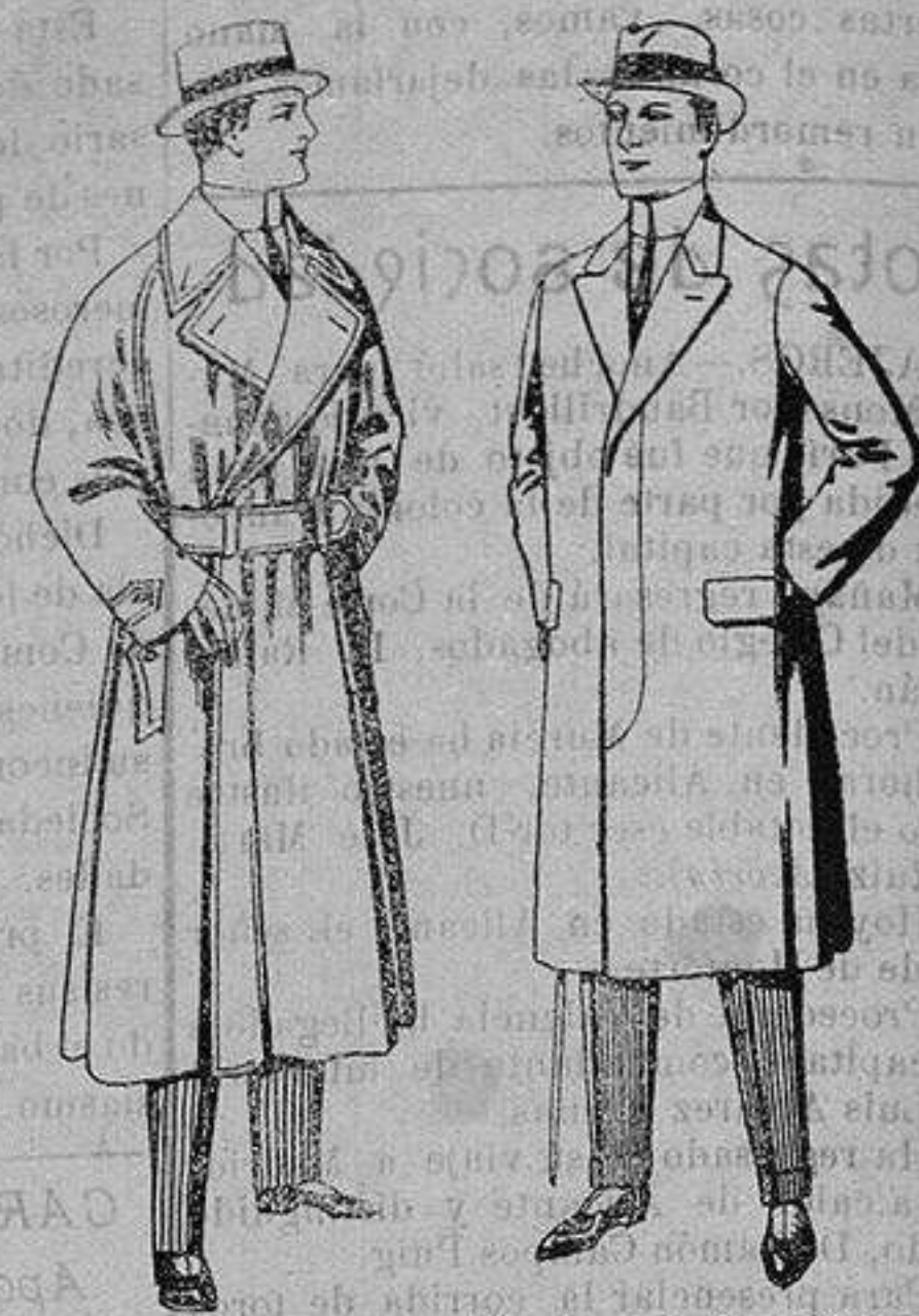
Gabanes impermeabilizados en color beige. De ptas. 65 a 110 Pardesus de melton o vigonia De ptas. 25 a 100