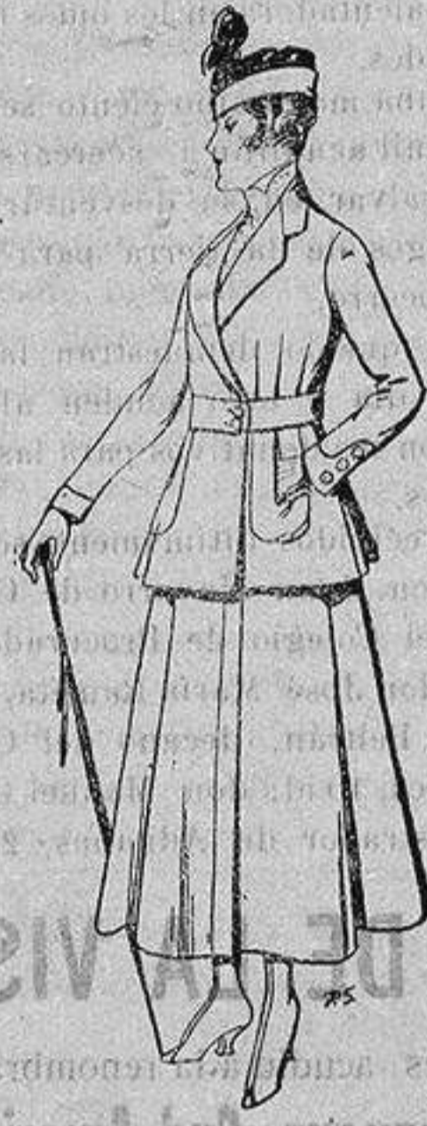
Trajes de lana negra azul y color, para señora De ptas. 50 a 55

Peletería, Camisería, Generos de Punto, Corbatería, Guantería, Sombrerería, Zapatería, Paraguas, Bastones y Artículos de Viaje.