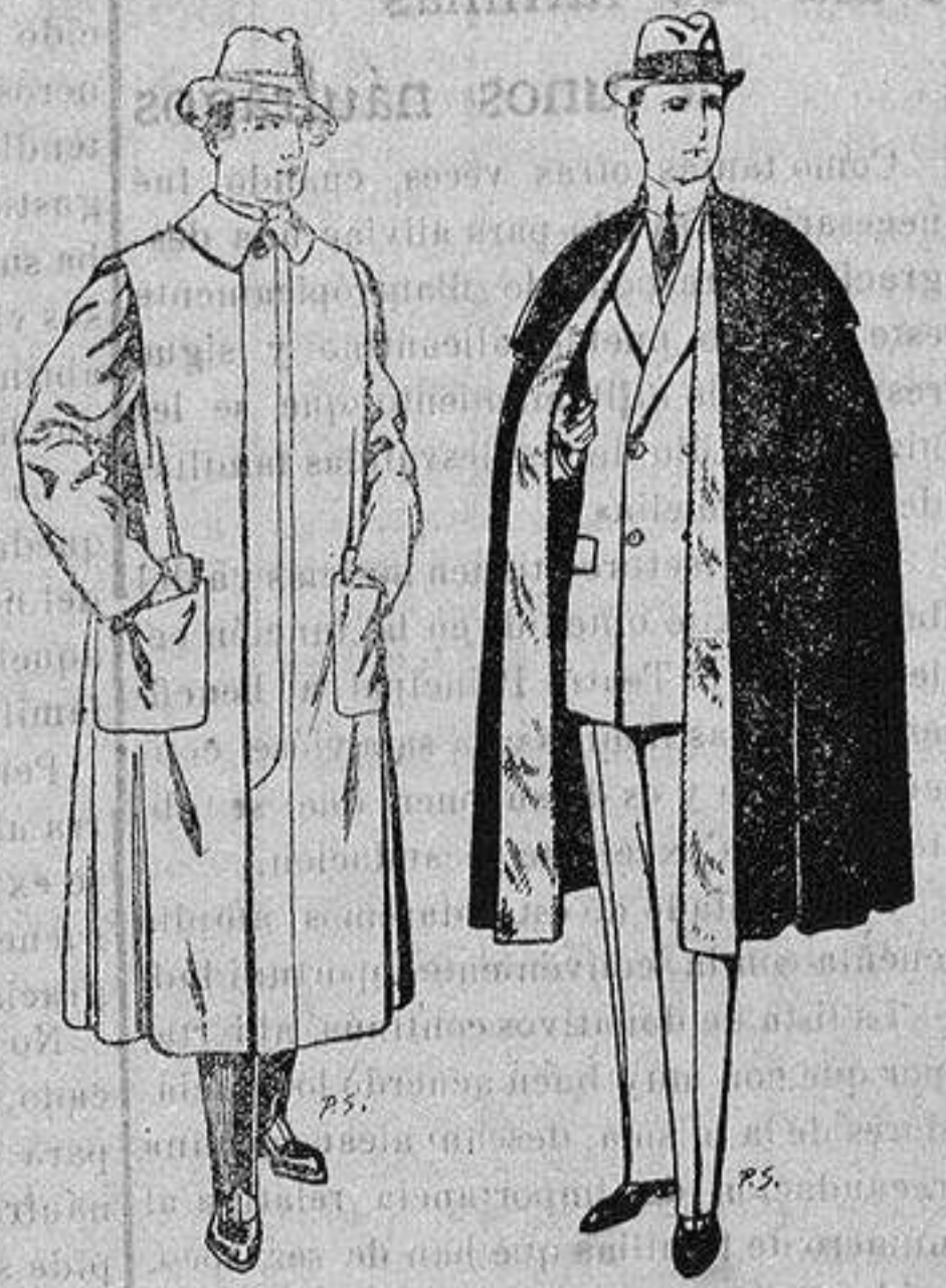
Impermeables forma gabán en color beige o gris De ptas. 35 a 100