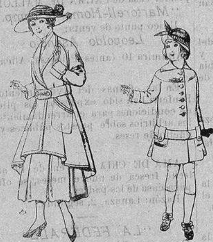
Abrigos de patén para jovencitas de 13 a 16 años De ptas. 25 a 35