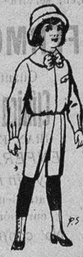
Trajes de patén para niños de 4 a 9 años De ptas. 5 a 7'50