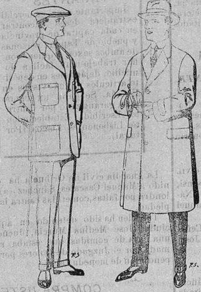
Trajes de cheviot corte elegante para "Sportman" De 35 a 50 ptas.

Madrid, Barcelona, Alicante, Almería, Bilbao, Cádiz, Cartagena, Gijón, Granada, Málaga, Palma de Mallorca, Santander, Sevilla, Valencia, Valladolid y Zaragoza.