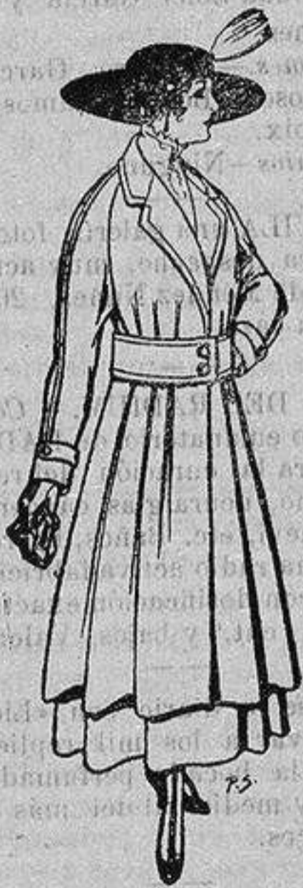
Abrigos de patén gran novedad para señora A ptas. 53

Ropas confeccionadas para Caballero, Señora, Niño y Niña