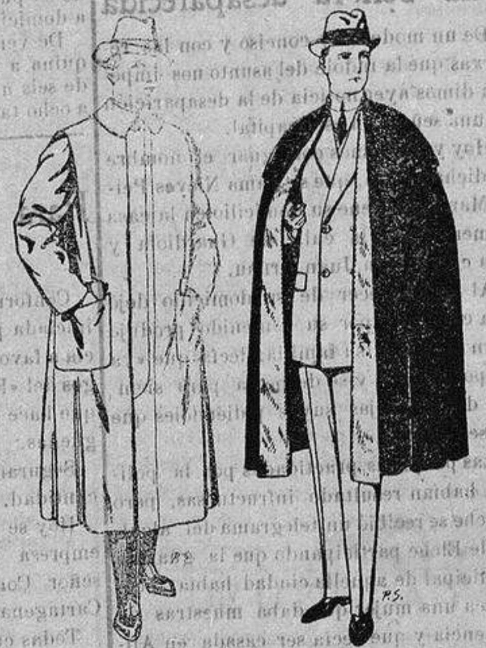
Impermeables forma gabán en color beige o gris De ptas. 35 a 100 Capas (enteras) de paño De ptas. 25 a 100