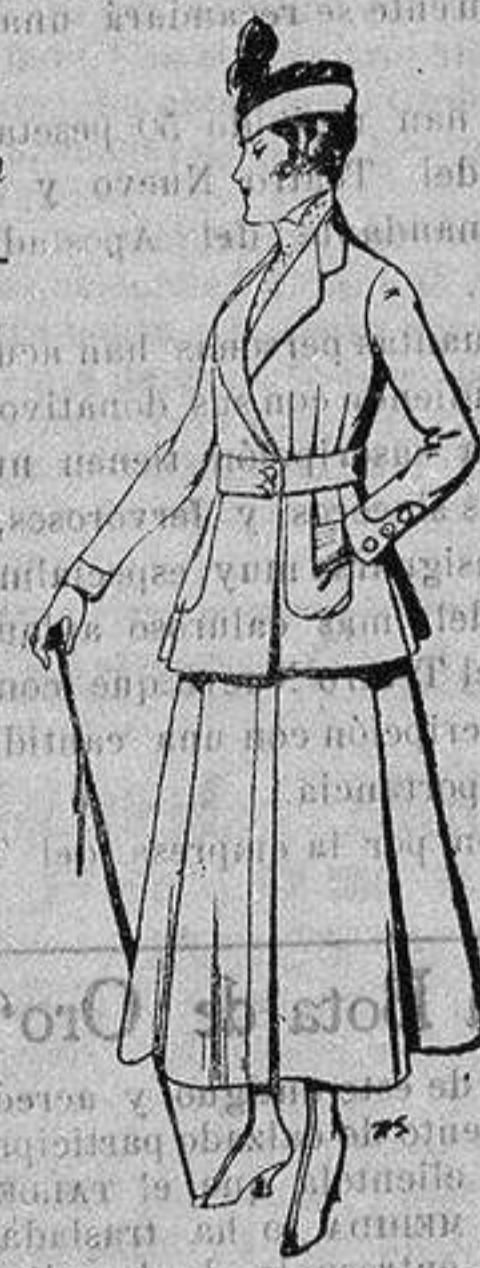
Trajes de lana, negra azul y color, para señora y niña De ptas. 50 a 55