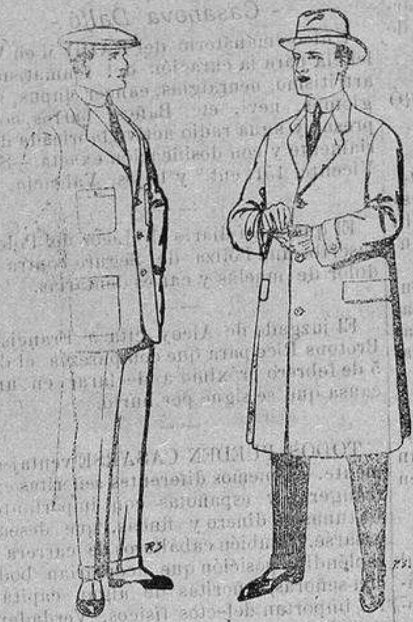
Trajes de cheviot corte elegante para "Sportman" De 35 a 50 ptas. Gabanes de tejido pluma o satina De ptas. 30 a 100

Madrid, Barcelona, Alicante, Almería, Bilbao, Cádiz, Cartagena, Gijón, Granada, Málaga, Palma de Mallorca, Santander, Sevilla, Valencia, Valladolid y Zaragoza