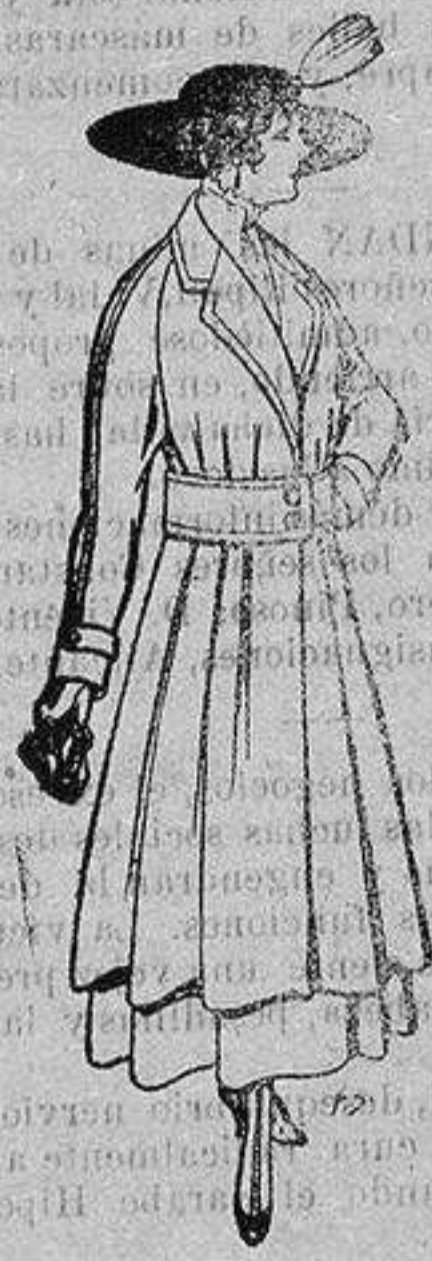
Abrigos de patén gran novedad para señora A ptas. 53