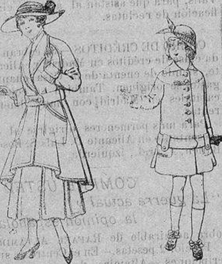
Abrigos de patén para jovencitas de 13 a 16 años De ptas. 25 a 35 Abrigos de patén para niños de 4 a 12 años De ptas. 15 a 25