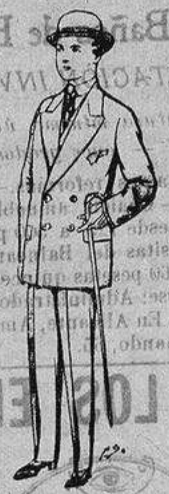
Trajes de patén, vicuña, etc., para niños de 10 a 16 años De ptas. 25 a 48