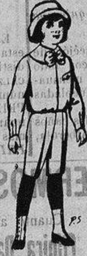
Trajes de patén para niños de 4 a 9 años De ptas. 5 a 7'50