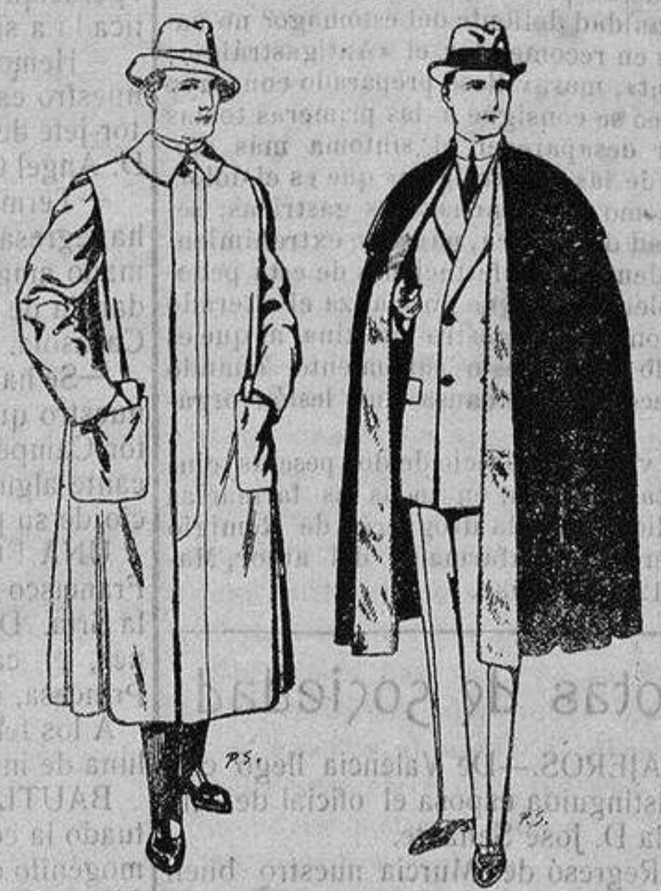
Impermeables forma gabán en color beige o gris De ptas. 35 a 100