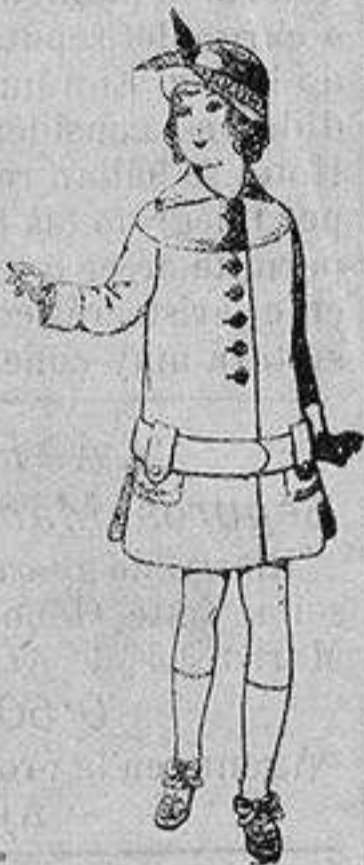
Abrigos de patén para niños de 4 a 12 años De ptas. 15 a 25