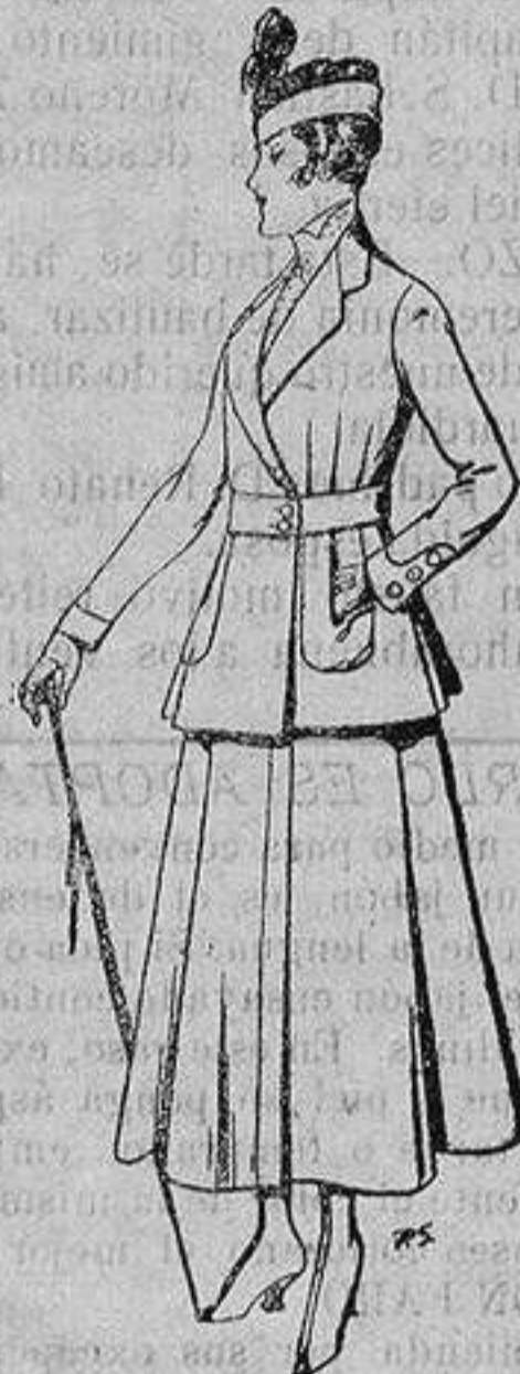
Trajes de lana negra azul y color, para señora De ptas. 50 a 55