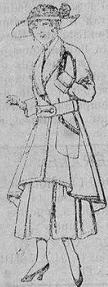
Abrigos de patén para jovencitas de 13 a 16 años De ptas. 25 a 35