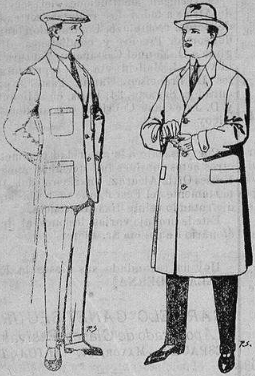
Trajes de cheviot corte elegante para «Sportman» De 35 a 50 ptas.

Peletería, Camisería, Generos de Punto, Corbatería, Guantería, Sombrerería, Zapatería, Paraguas, Bastones y Artículos de Viaje.