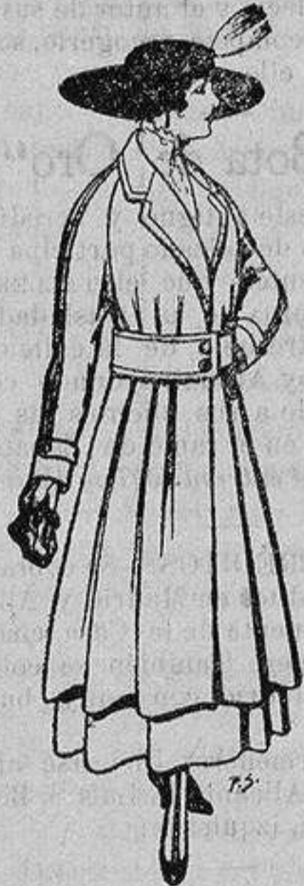
Abrigos de patén gran novedad para señora A ptas. 53