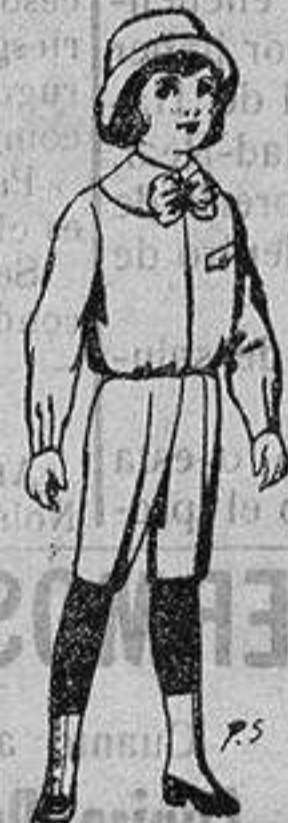
Trajes de patén para niños de 4 a 9 años De ptas. 5 a 7'50