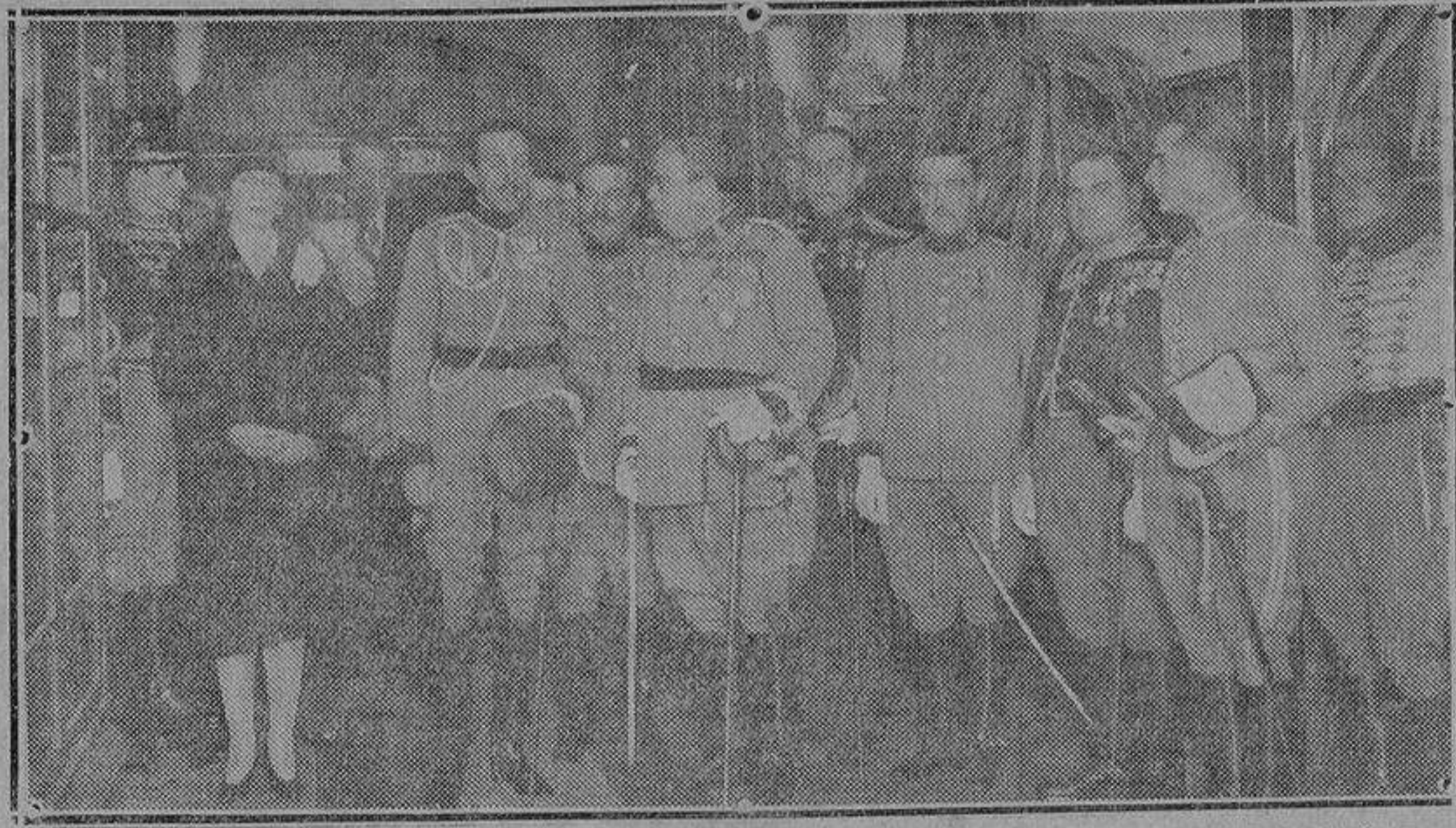
Sus Majestades los Reyes en el acto inaugural del Museo del Arma de Caballería