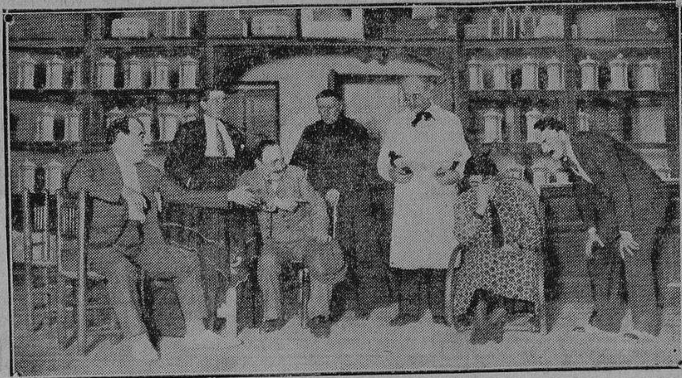
Una escena de la comedia «Un millón» estrenada en el Teatro Alkázor