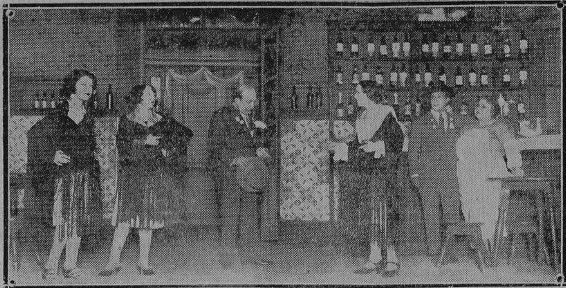
Una de las más interesantes escenas de «Los Flamencos» obra del maestro Vives Fque ha obtenido un ruidoso éxito en el Teatro Apolo de Madrid.