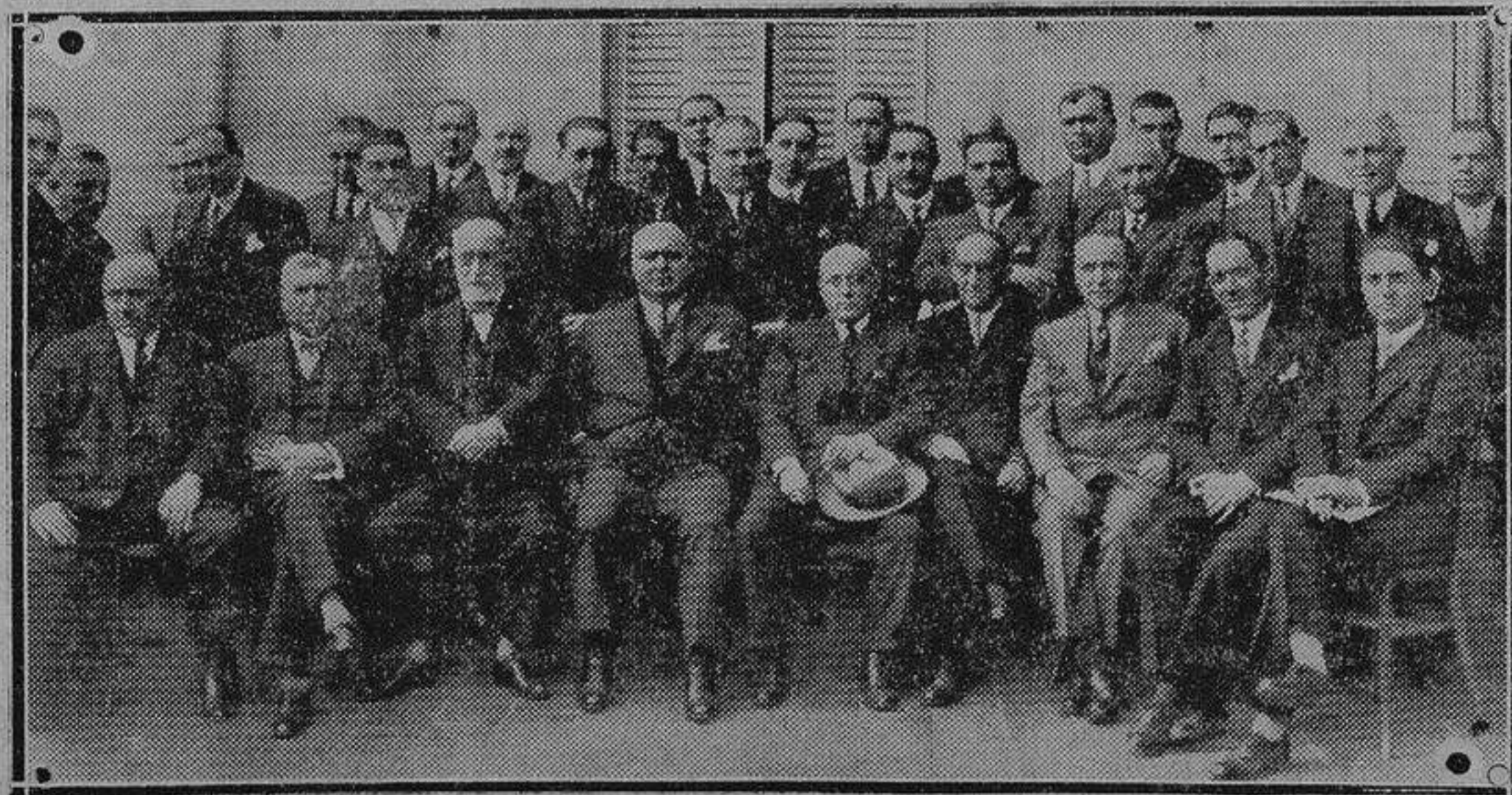
Grupo de concurrentes a la Asamblea de Comisionistas y Agentes de Aduanas que se celebra en la corte actualmente