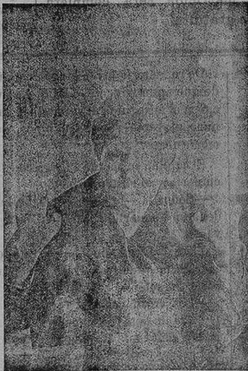
Retrato de una leprosa

pueblos circunvecinos, bien podemos sacar en consecuencia, que el Sanatorio constituye en parte, como un regalo que se nos hace al distrito para albergar en él con comodidad a los hijos del país que sufren tan horrible mal, y para dar tranquilidad a los sanos, porque también es evidente, que recogidos todos los enfermos en un punto, y estando convenientemente asistidos y cuidados, tiene más garantías la salud pública, porque quedan reducidos a uno todos los puntos de contagio. ¿De contagio? Eso es lo que no se sabe con certeza; lo único que se sabe es, que un lazareto abandonado de los actuales, además