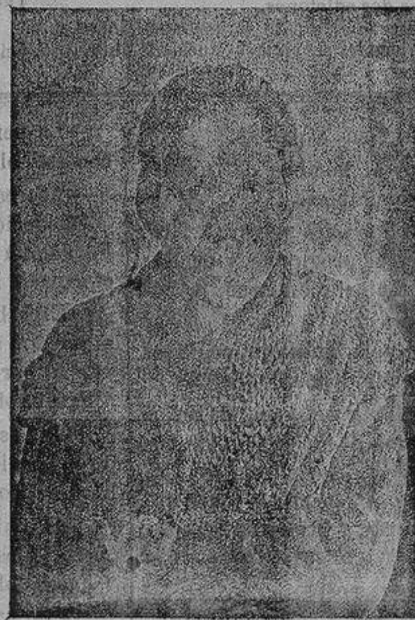
Retrato de una leprosa

Cuántos hombres hay en el mundo que dotados de condiciones no llegan nunca a ser «nada» por su «mala estrella» que les persigue; y otros, tan afortunados que no