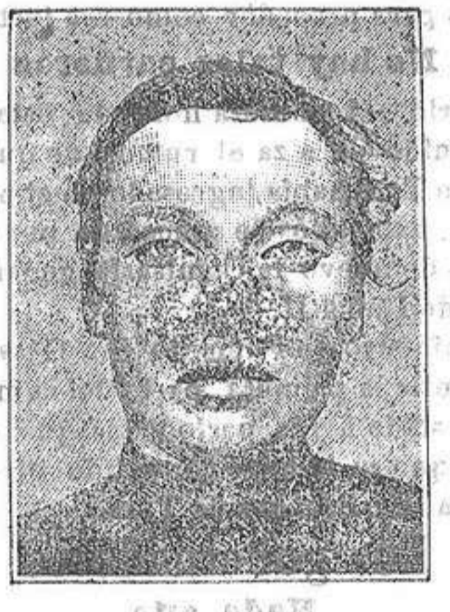
Después de la curación