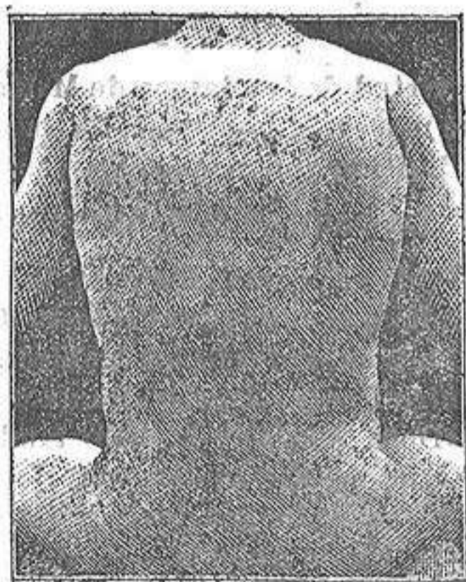
Después de la curación