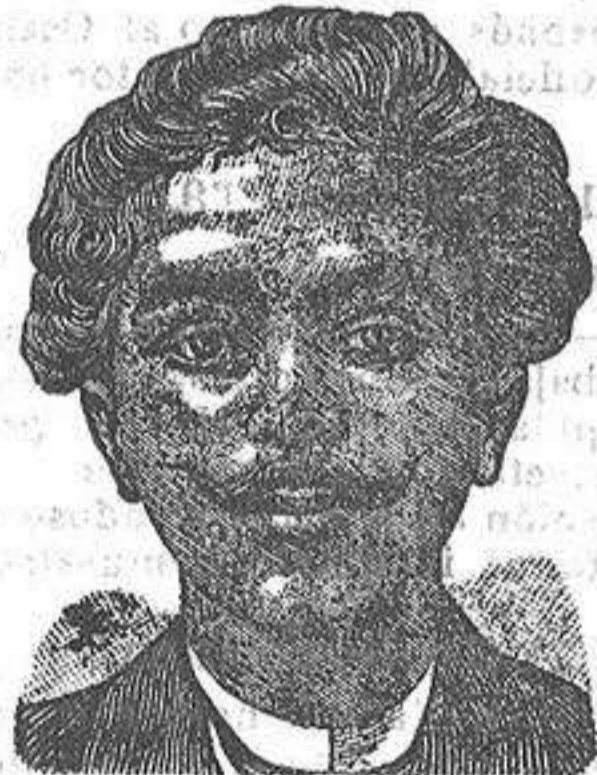
Después de la curación