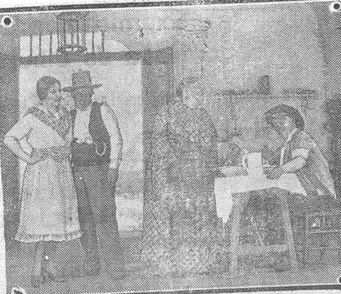
Una escena de la obra «Los ilustres gañanes» uno de los éxitos de esta temporada en la Comedia de Madrid.