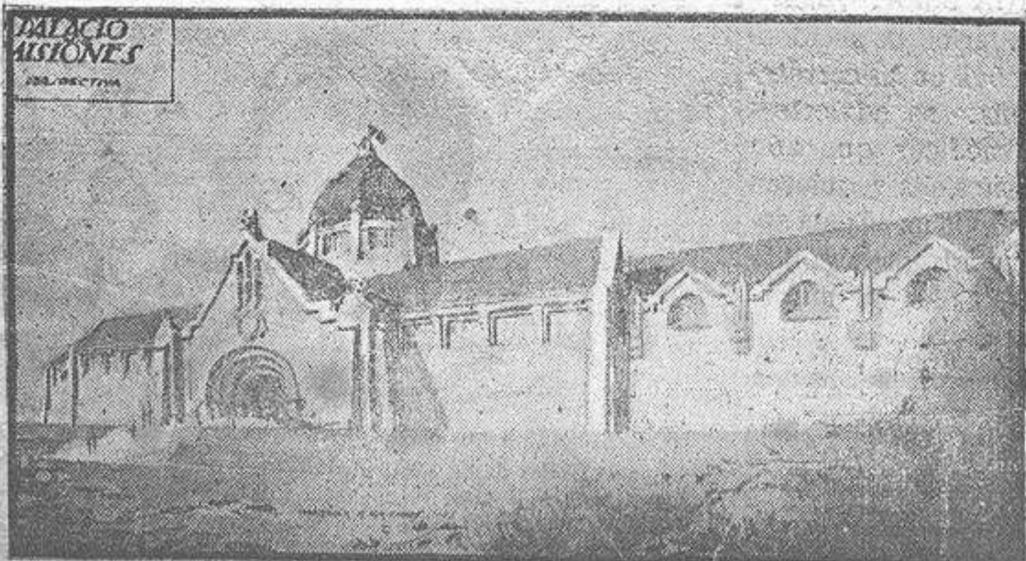
Duro aspecto del monumental certamen de España.

zará por inclinarse la victoria a sus respectivos colores.