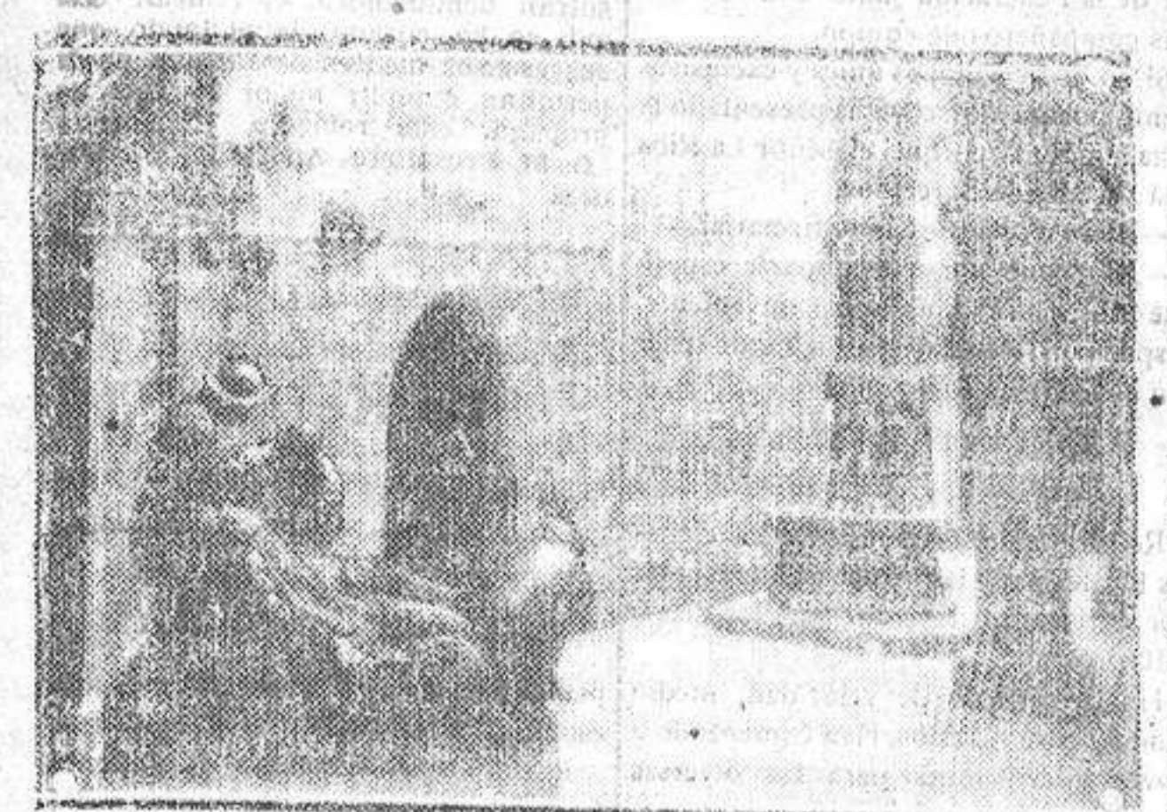
Alto de la casa natalicia de San Ignacio de Loyola