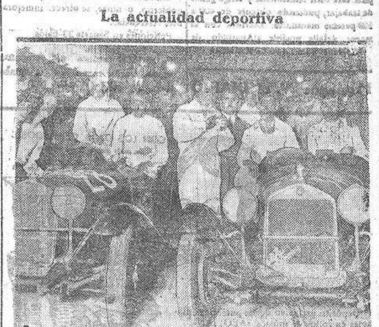
Una de las escenas típicas en los preparativos para la prueba automovilística de San Sebastián