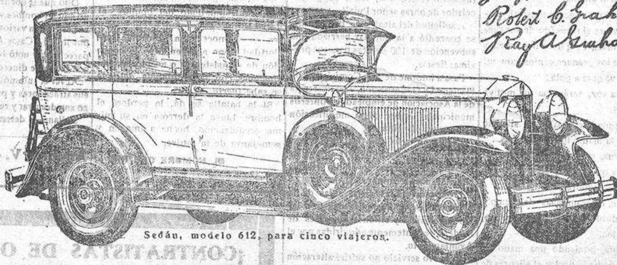
Sedán, modelo 612, para cinco viajeros.