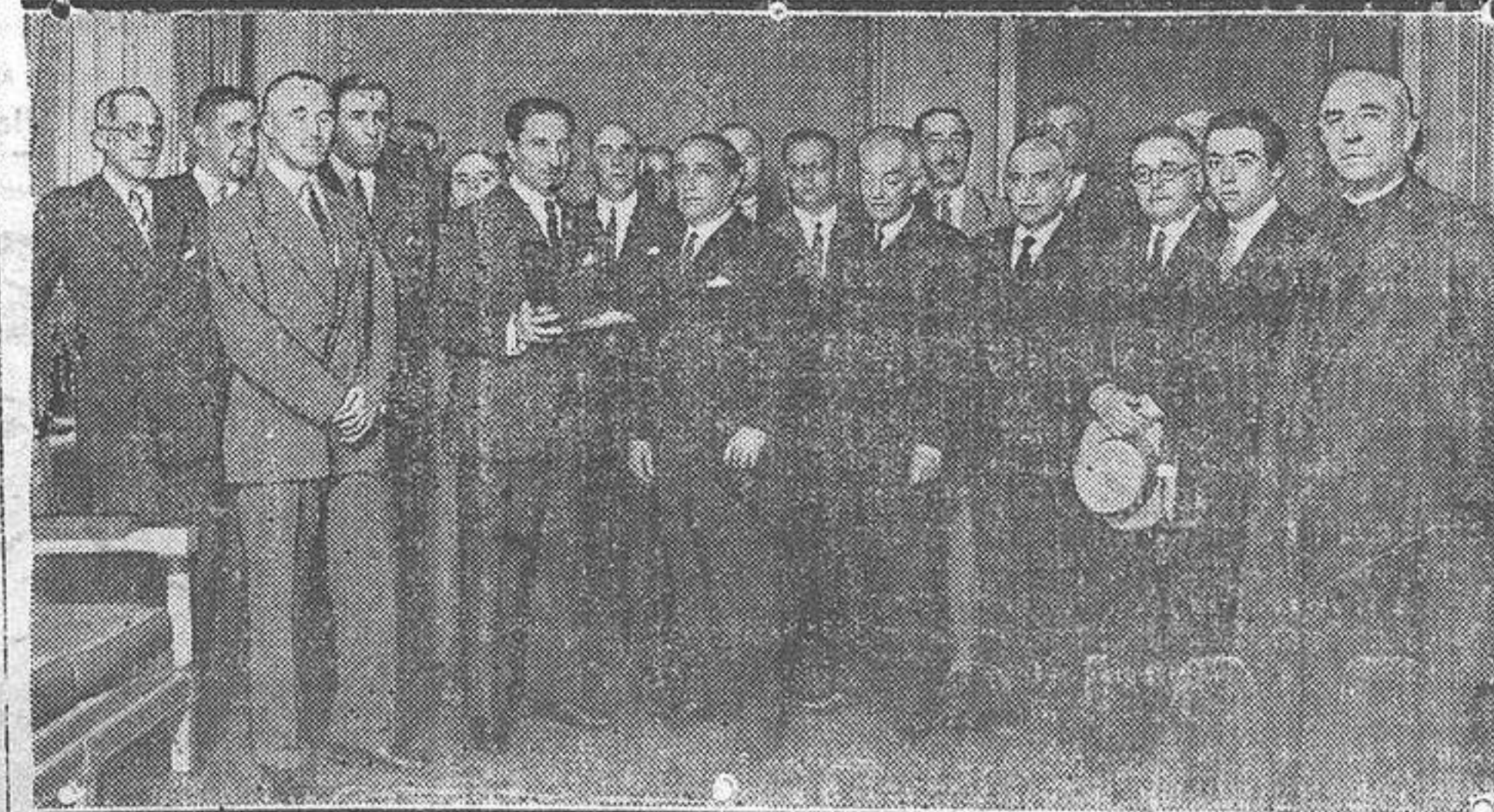
El presidente de la Asamblea entregando al director de monumentos las insignias de la encomienda de la Orden del Mérito civil.