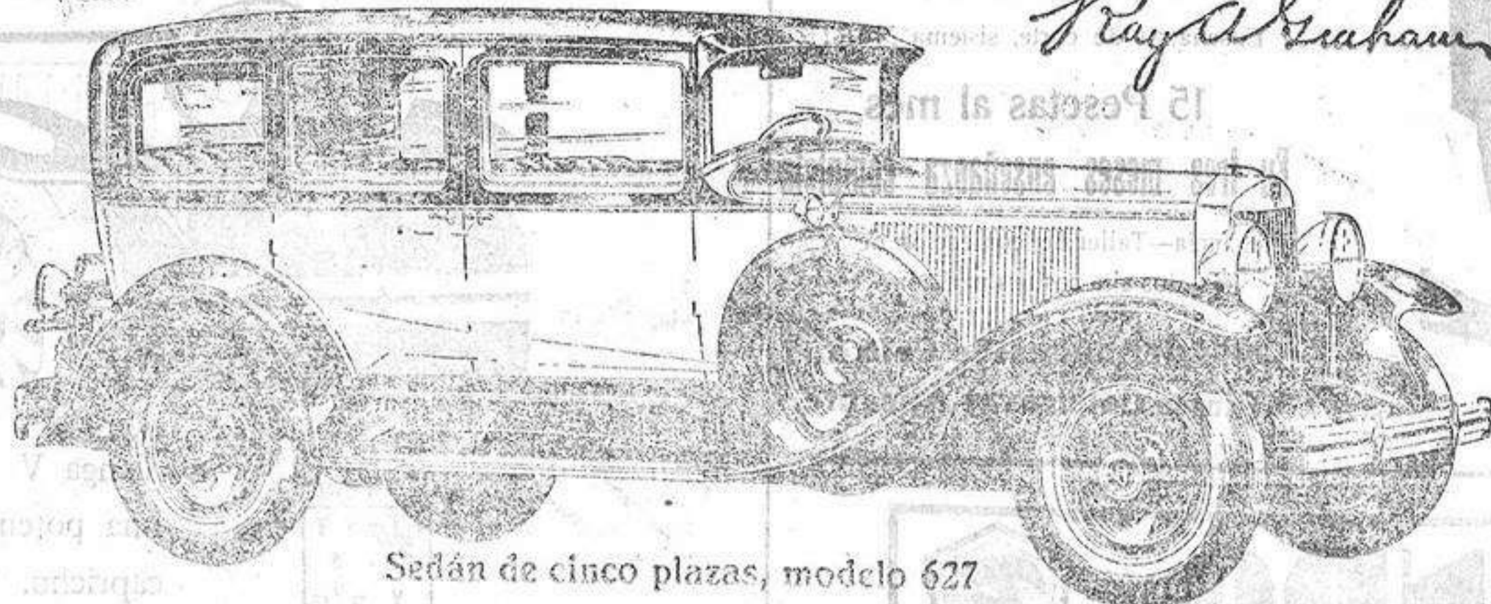
Sedán de cinco plazas, modelo 627

Estos nuevos modelos Graham-Paige para 1929, ofrecen una gran variedad de carrocerías, incluyendo Roadsters, Cabriolets, Coupés y Sport Phaetons, sobre cinco chassis distintos, de seis y ocho cilindros, a precios al alcance de todos. Van provistos de transmisión de cuatro velocidades, exceptuando el modelo 612.