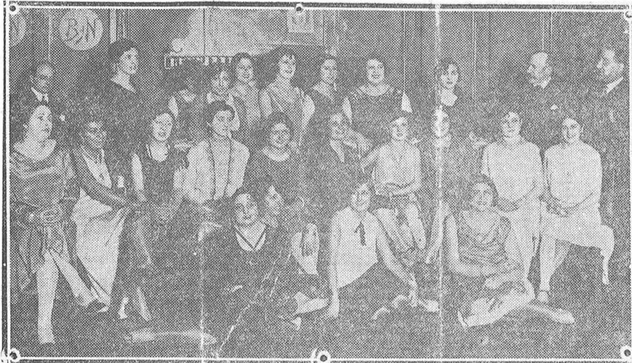
He ahí el espléndido escarapate de la belleza española tan felizmente logrado por «A B C» con su concurso que ha constituido la actualidad nacional de esta semana. Los juzgadores Benlliure, Cadenas y Benedito aparecen un poco perplejos y asombrados. ¡Para todo hay!