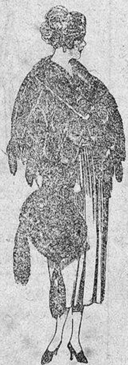
Juego pieles, imitación Renard negro, de pesetas 100 a 150.