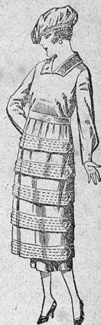
Vestidos de estambre, gabardina, sarga, etc., en negro, azul y color, pespunte y adorno, de ptas. 110 a 140.