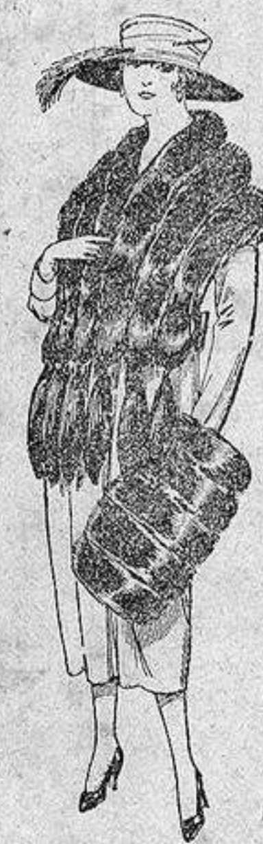
Juego de pieles, imitación "Colombia", negro, de pesetas 40 a 100.