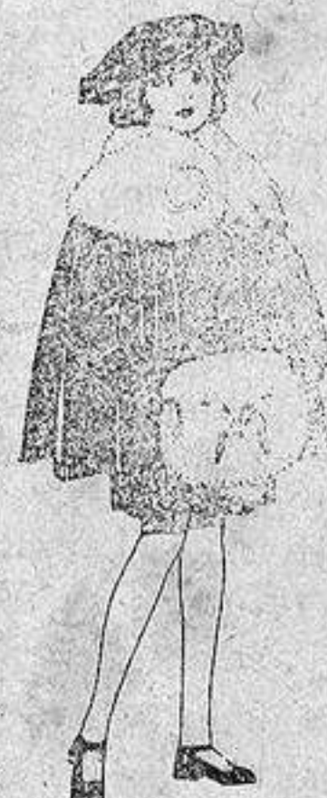
Juego de pieles blanco, imitación armiño, para niñas, de ptas. 16 a 21.