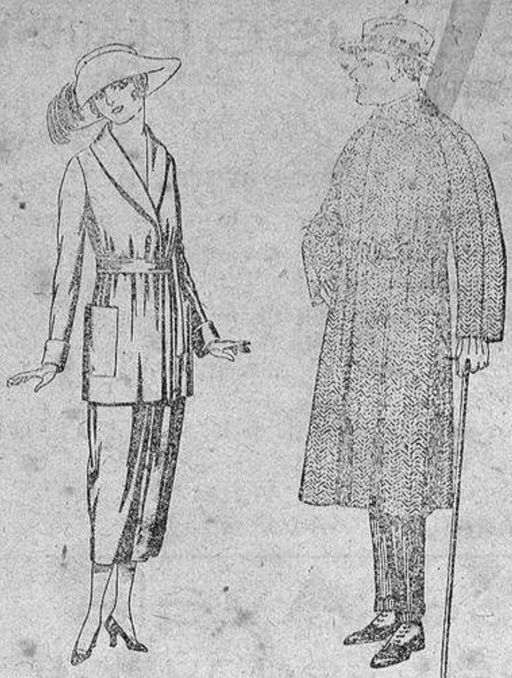
Trajes de punto de lana. Gabanes de patén, cha- negro, azul y colores, violet o cover, de pesetas de 150 a 250. 85 a 136.

SUCURSALES: Madrid, Barcelona, Almería, Bilbao, Cádiz, Cartagena, Gijón, Granada, Málaga, Palma de Mallorca, Santander, Sevilla, Valencia, Valladolid y Zaragoza.