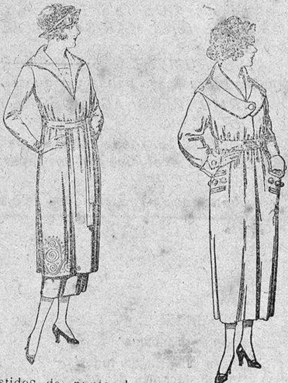
Vestidos de punto de lana azul y color, adornos bordados, de pesetas 149 a 250.