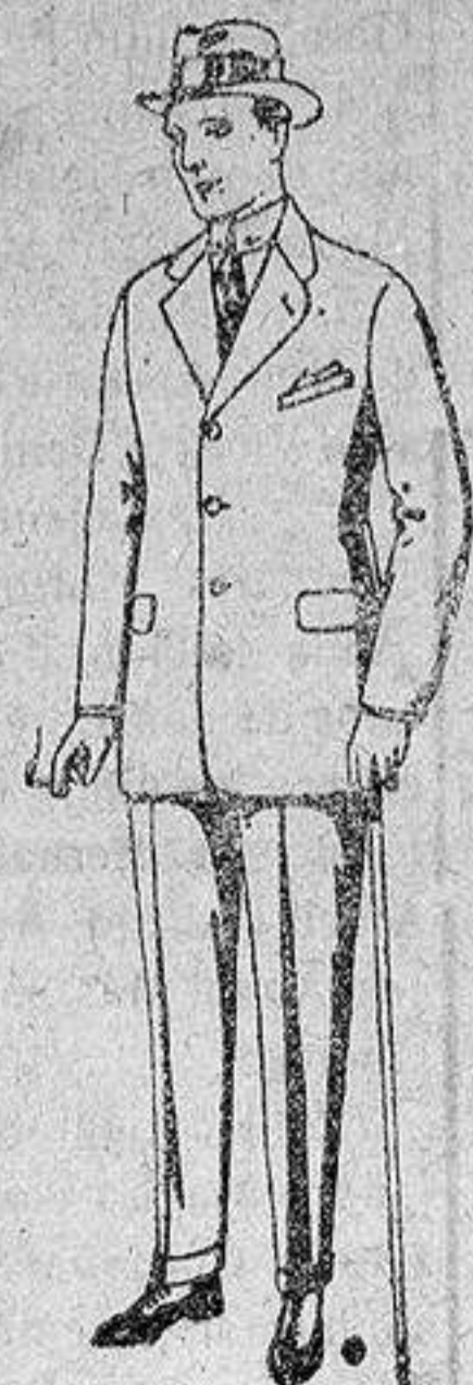
Trajes de chaviot con cinturón, elegante corte, para Sportman, de pesetas 53 a 125.