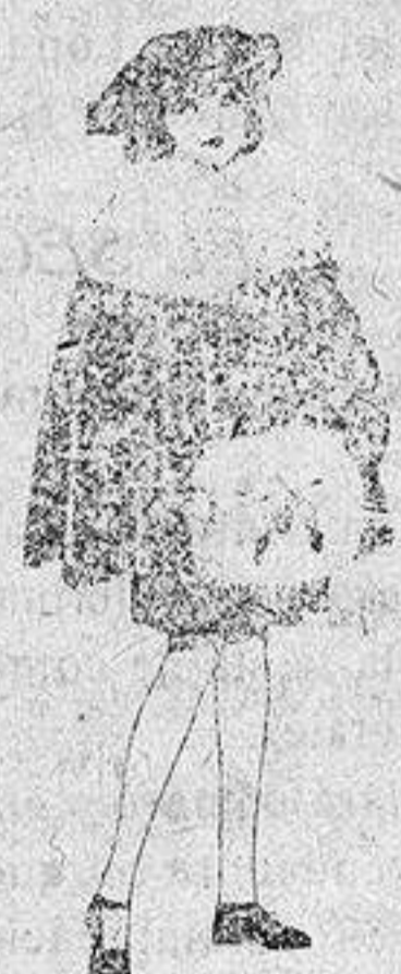
Juego de pieles blanco, imitación armiño, para niñas, de ptas. 16 a 21.