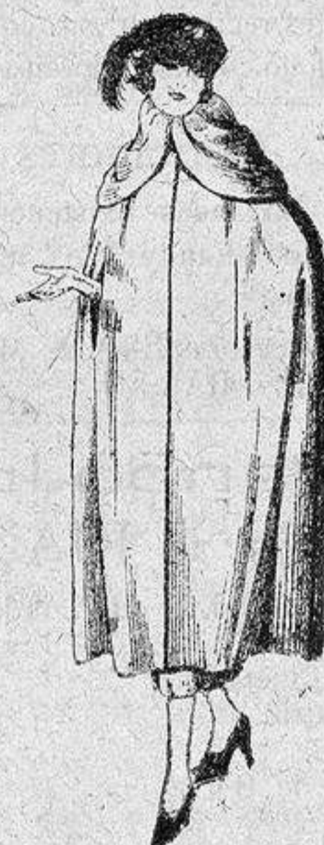
Capas de gabardina inglesa, diferentes colores, de ptas. 110 a 130.