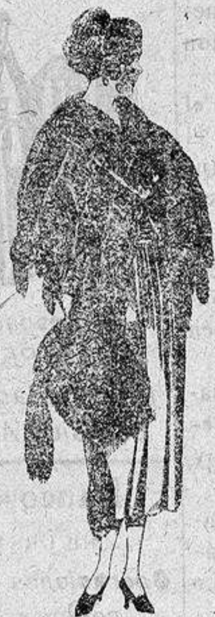
Juego pieles, imitación Renard negro, de pesetas 160 a 150.