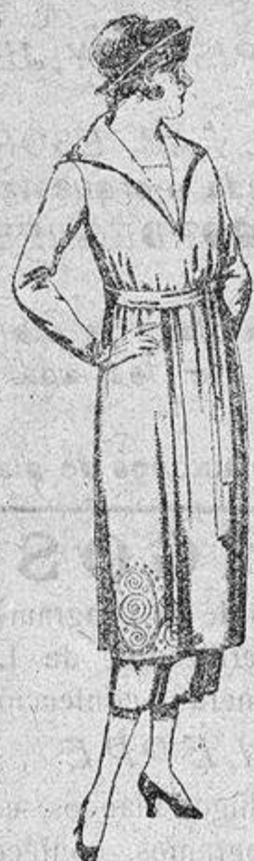
Vestidos de punto de lana azul y color, adornos bordados, de pesetas 149 a 250.