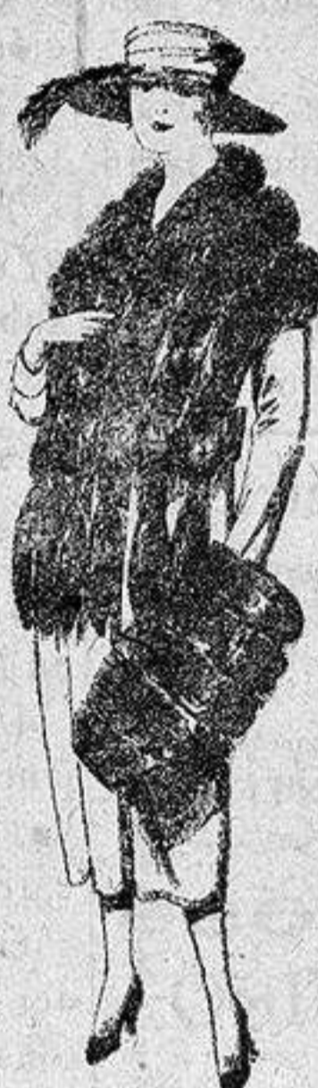
Juego de pieles, imitación 'Colombia', negro de pesetas 40 a 100.