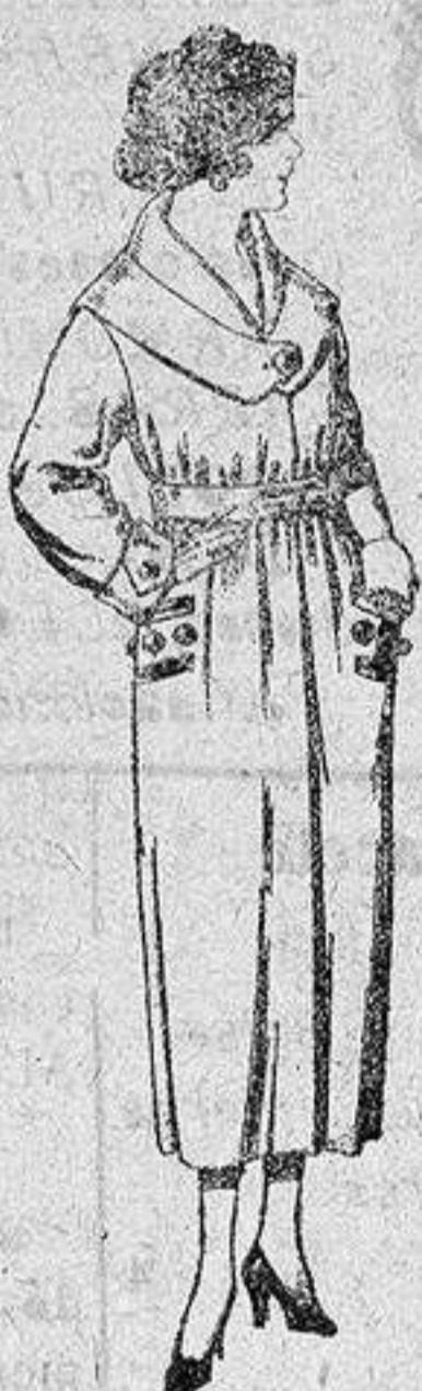
Abrigos de gamuza, pañete, etc., en negro, azul y color, de ptas. 45 a 90