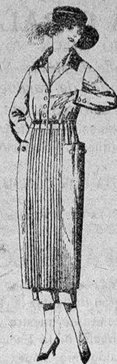
Vestidos de sarga inglesa, estambre, etc., en negro, azul y color, adornos punto, de pesetas 118 a 150.