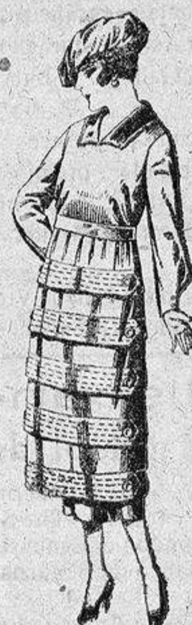
Vestidos de estambre, gabardina, sarga, etc., en negro, azul y color, puntos y adorno, de ptas. 110 a 140.