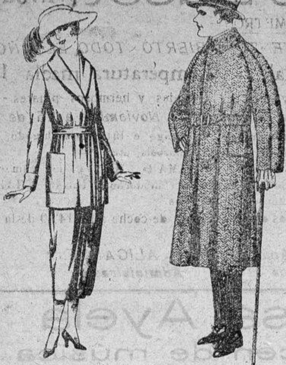
Trajes de punto de lana negro, azul y colores, de pesetas 150 a 250. Gabanes de patén, chaviot o cover, de pesetas 85 a 136.

SUCURSALES: Madrid, Barcelona, Almera, Bilbao, Cádiz, Cartagena, Gijón, Granada, Málaga, Palma de Mallorca, Santander, Sevilla, Valencia, Valladolid y Zaragoza.