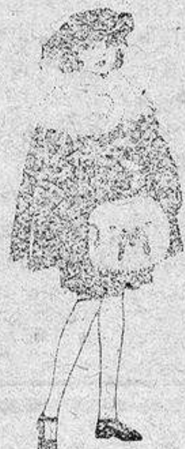
Juego de pieles blanco, imitación armiño, para niñas, de ptas. 16 a 21.