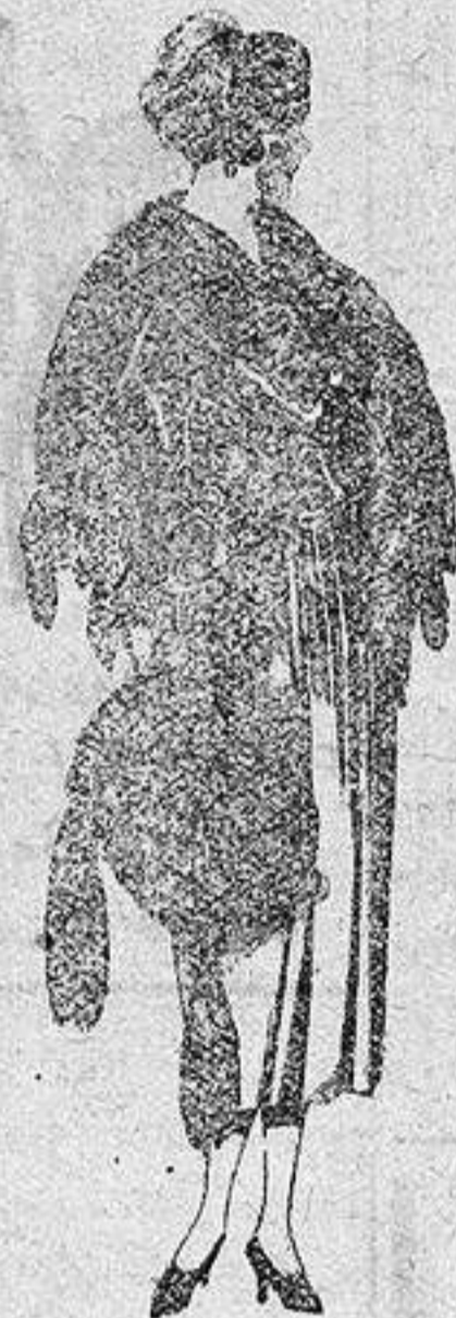
Juego pieles, imitación Renard negro, de pesetas 100 a 150.