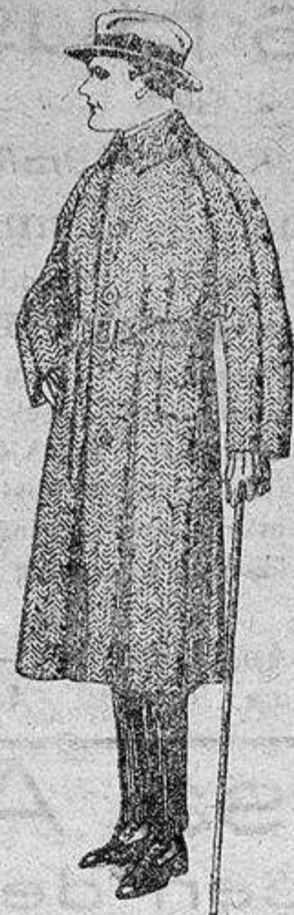
Trajes de punto de lana negro, azul y colores, de pesetas 150 a 250. Gabanes de patén, chaviot o cover, de pesetas 85 a 136.