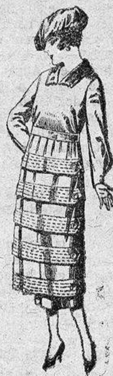
Vestidos de estambre, gabardina, sarga, etc., en negro, azul y color, adornos y adorno de ptas. 110 a 140.