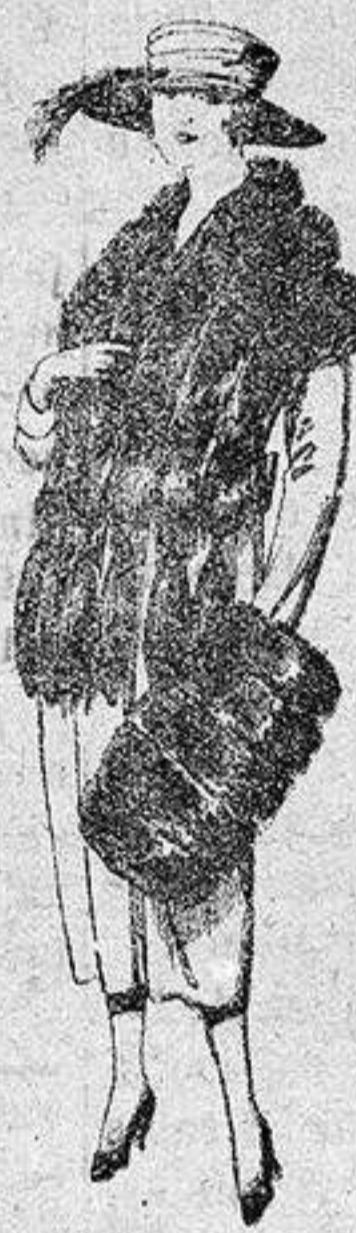
Juego de pieles, imitación "Colombia", negro de pesetas 40 a 100.