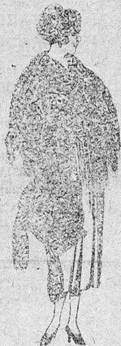
Juego pieles, imitación Renard negro, de pesetas 100 a 150.