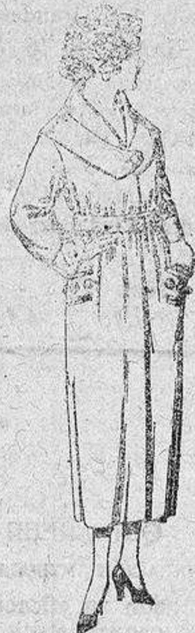
Abrigos de gamuza pañete, etc., en negro, azul y color, de 45 a 99 pesetas.