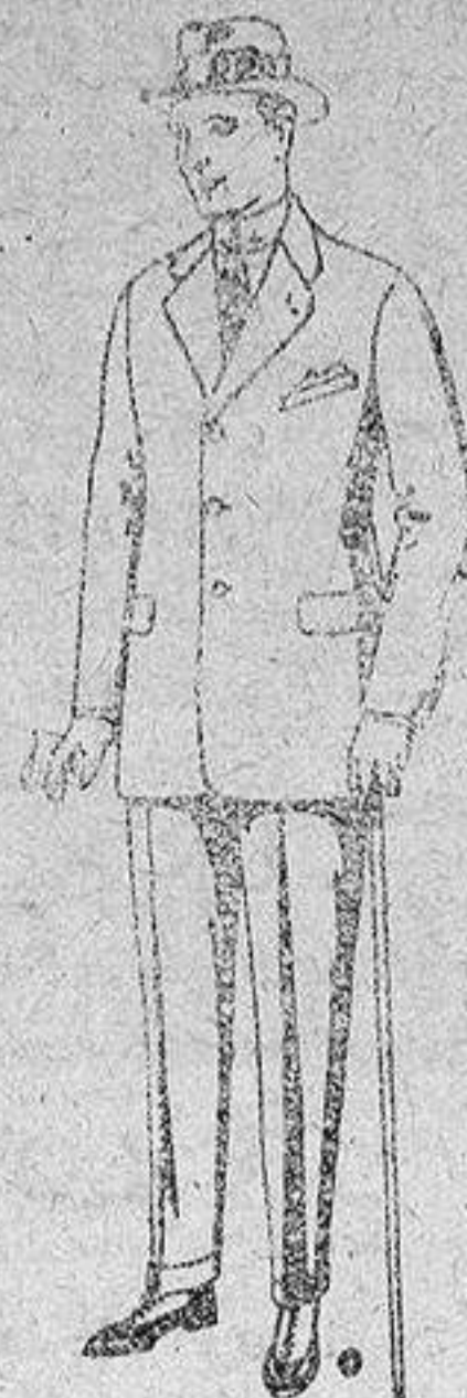
Trajes de chaviot con cinturón, elegante corte, para Sportman, de pesetas 58 a 125.