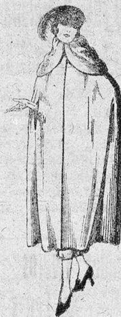
Capas de gabardina inglesa, diferentes colores, de 110 a 130 pesetas.