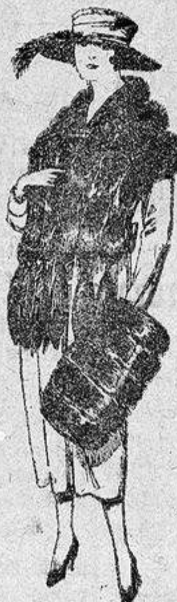
Juego de pieles, imitación «Colombia», negro, de pesetas 40 a 100.