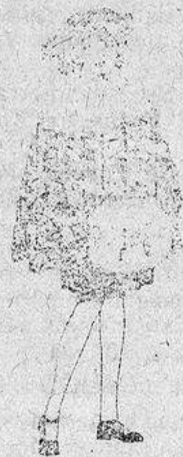
Juego de pieles blanco, imitación armiño, para niñas, de 16 a 21 pesetas.