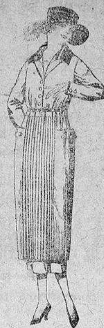
Vestidos de sarga inglesa, estambre, etc., en negro, azul y color, adornos punto, de pesetas 118 a 150.