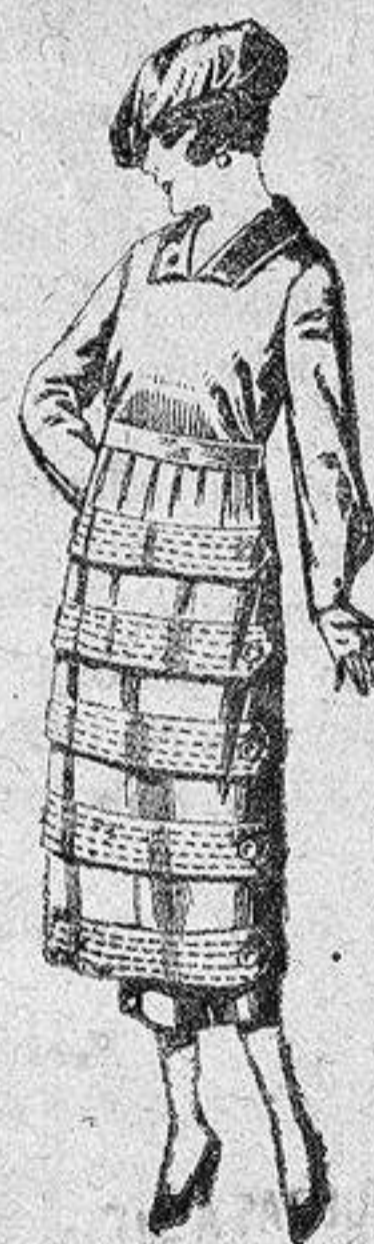
Vestidos de estambre, gabardina, sarga, etc., en negro, azul y color, pespunte y adorno, de 110 a 140 pesetas.