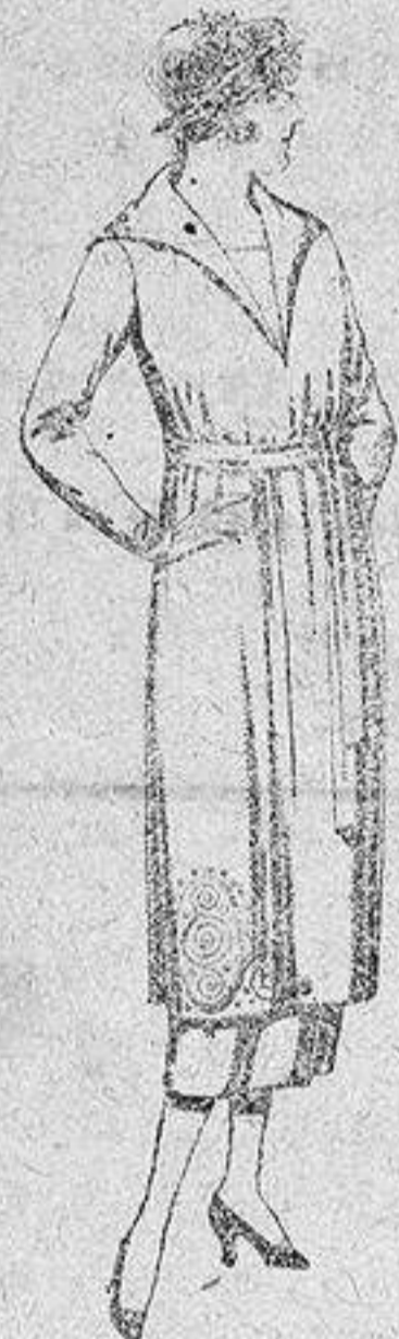
Vestidos de punto de lana azul y color, adornos bordados, de pesetas 149 a 250.