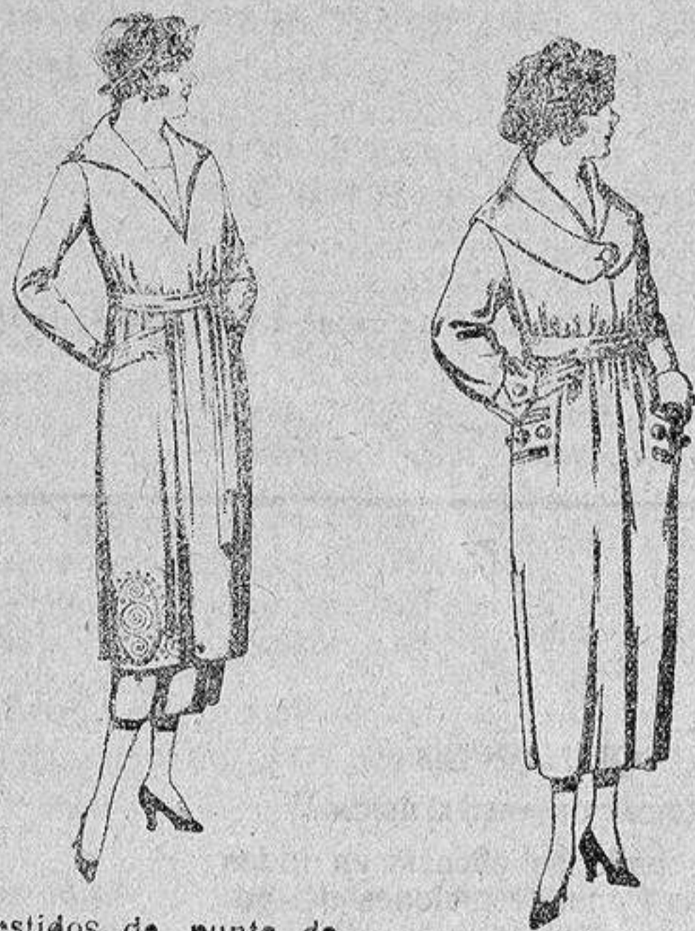
Vestidos de punto de lana azul y color, adornos bordados, de pesetas 145 a 250. Abrigos de gamuza pafiete, etc., en negro, azul y color, de ptas. 45 a 90