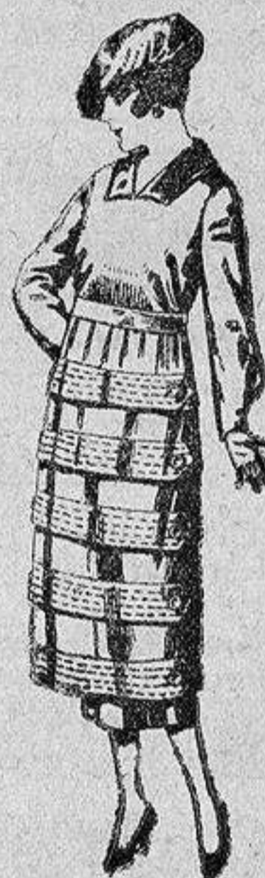
Vestidos de estambre, gabardina, sarga, etc., en negro, azul y color, pespunte y adorno, de ptas. 110 a 140.