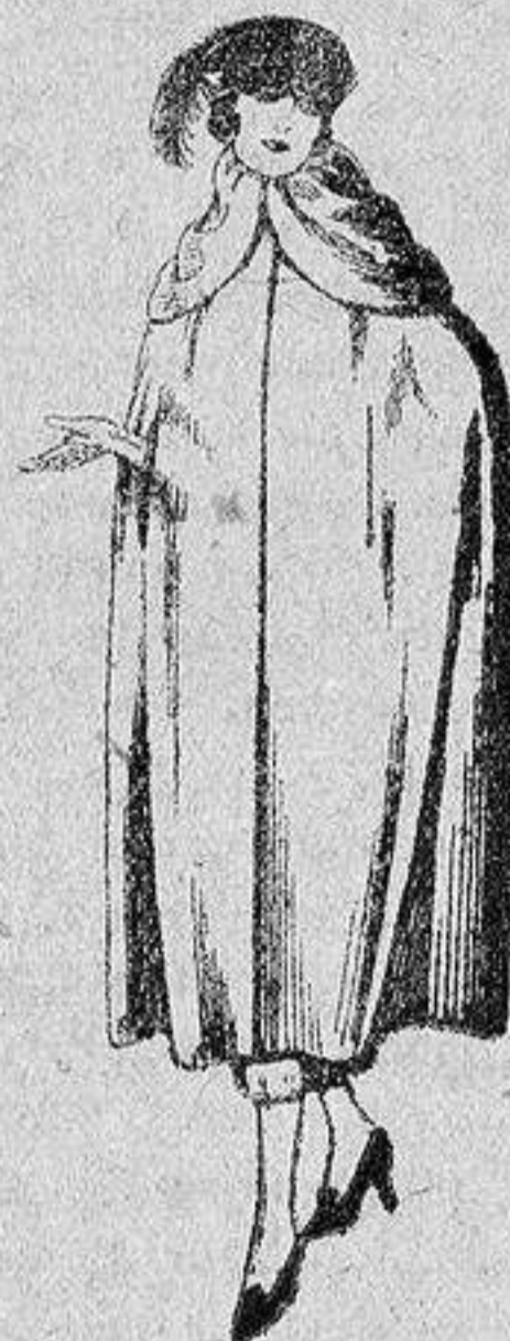
Capas de gabardina inglesa, diferentes colores, de ptas. 110 a 130.