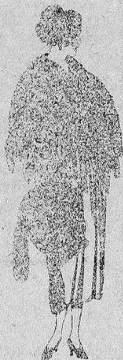
Juego pieles, imitación Renard negro, de pesetas 100 a 150.