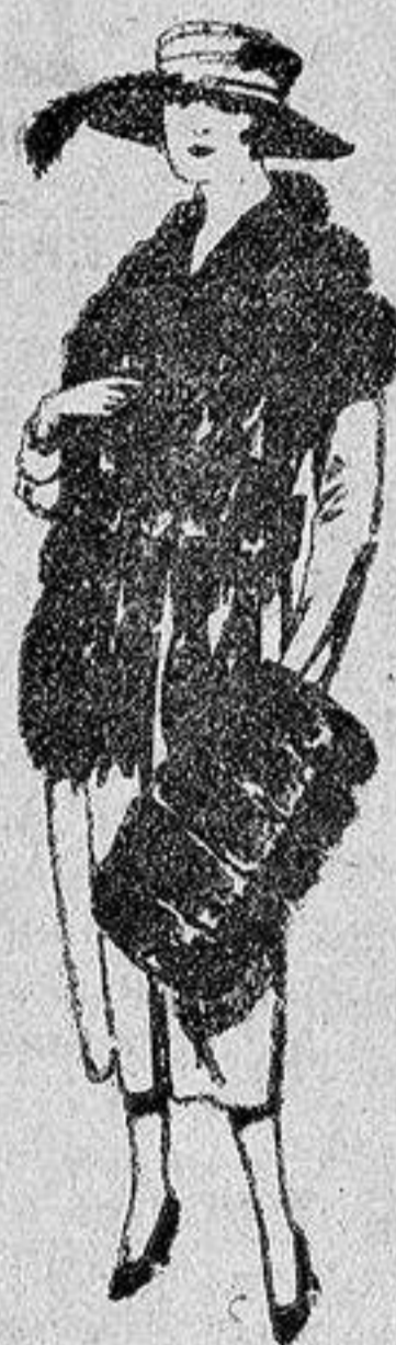
Juego de pieles, imitación «Colombia», negro de pesetas 40 a 100.