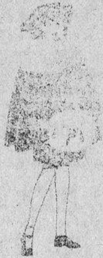
Juego de pieles blancas, imitación armiño, para niñas, de ptas. 16 a 21.