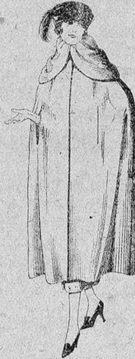
Capas de gabardina inglesa, diferentes colores, de ptas. 110 a 130.