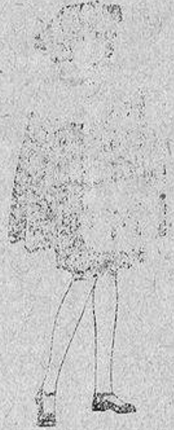
Juego de pieles blanco, imitación armiño, para niñas, de ptas. 16 a 21.