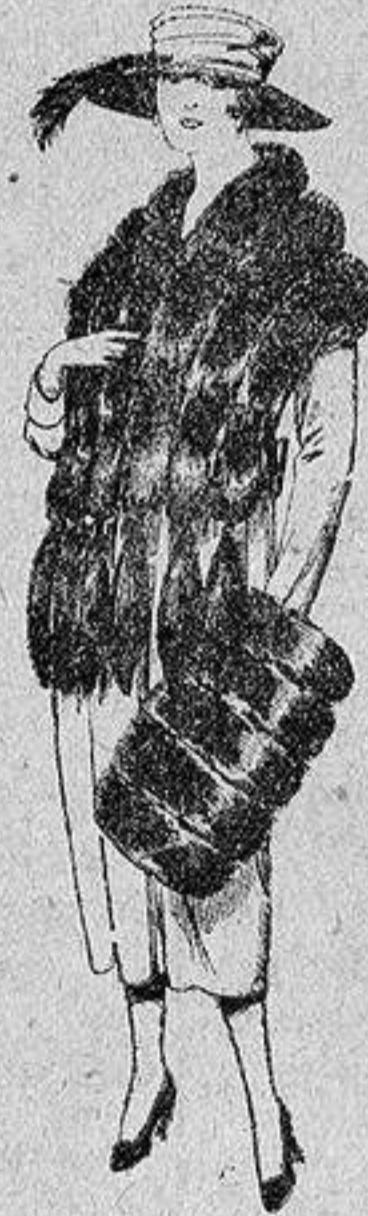
Juego de pieles, imitación Colombia, negro, de pesetas 40 a 100.