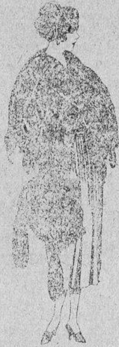
Juego pieles, imitación Renard negro, de pesetas 100 a 150.