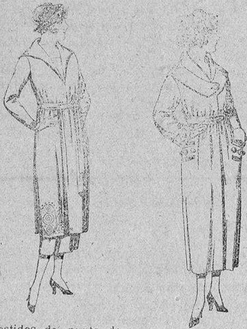
Vestidos de punto de lana azul y color, adornos bordados, de pesetas 149 a 250.