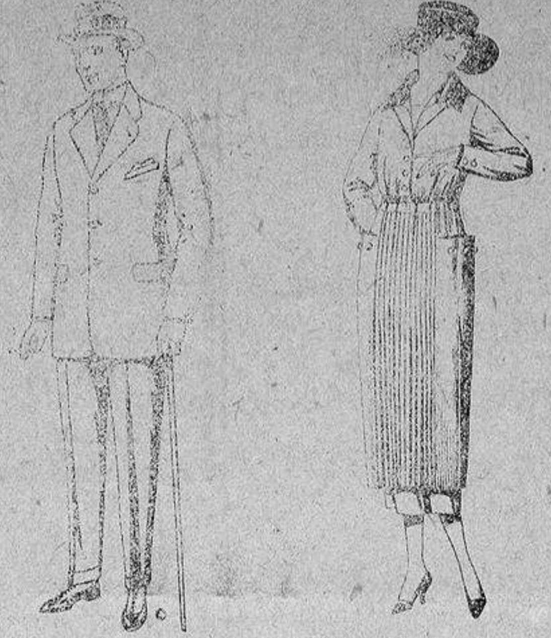
Trajes de chaviot con cinturón, elegante corte, para Sportman, de pesetas 53 a 125.