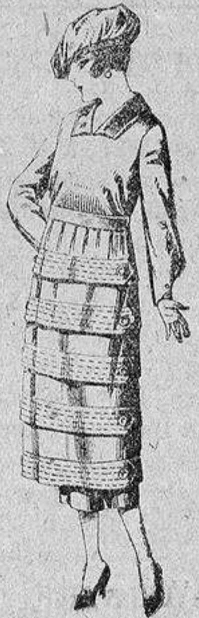
Vestidos de estambre, gabardina, sarga, etc., en negro, azul y color, pespunte y adorno, de ptas. 110 a 140.