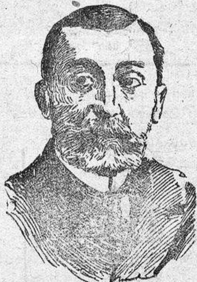
El ministro de la Gobernación Sr. Burgos Mazo, que ha reorganizado las plantillas del Cuerpo de Policía