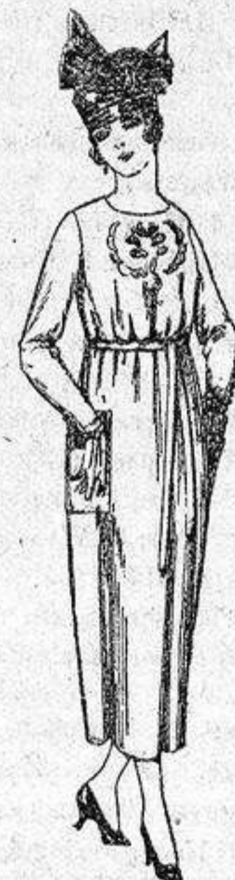
Vestidos de tricot de lana, en azul y colores, bordados a mano, a pesetas 112.

PRECIO FIJO - Pídase el catálogo general