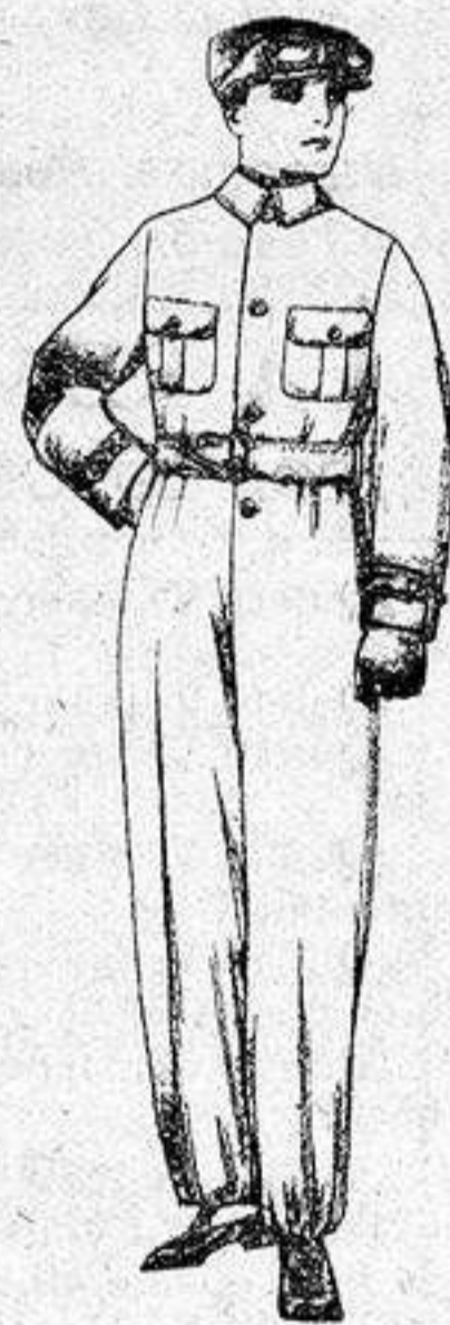
Trajes de dril azul, beige, kaki, etc., para aviador, motociclista, mecánico, etc., de ptas 18 a 25.

Camisería, Géneros de punto, Gorbatería, Guantería, Sombrerería, Zapatería, Paraguas, Bastones y artículos de viaje