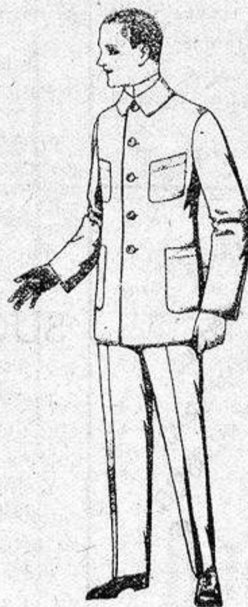
Trajes de dril azul, para mecánicos, de ptas. 17 a 25.

Camisería, Géneros de punto, Gorbatería, Guantería, Sombrerería, Zapatería, Paraguas, Bastones y artículos de viaje