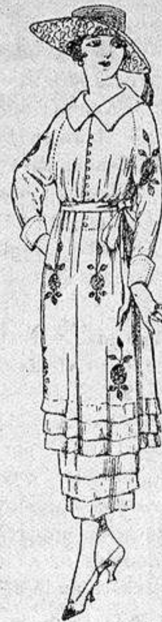
Vestidos de etamín blanco, azul y color, adornos bordados, de ptas 50 a 68.