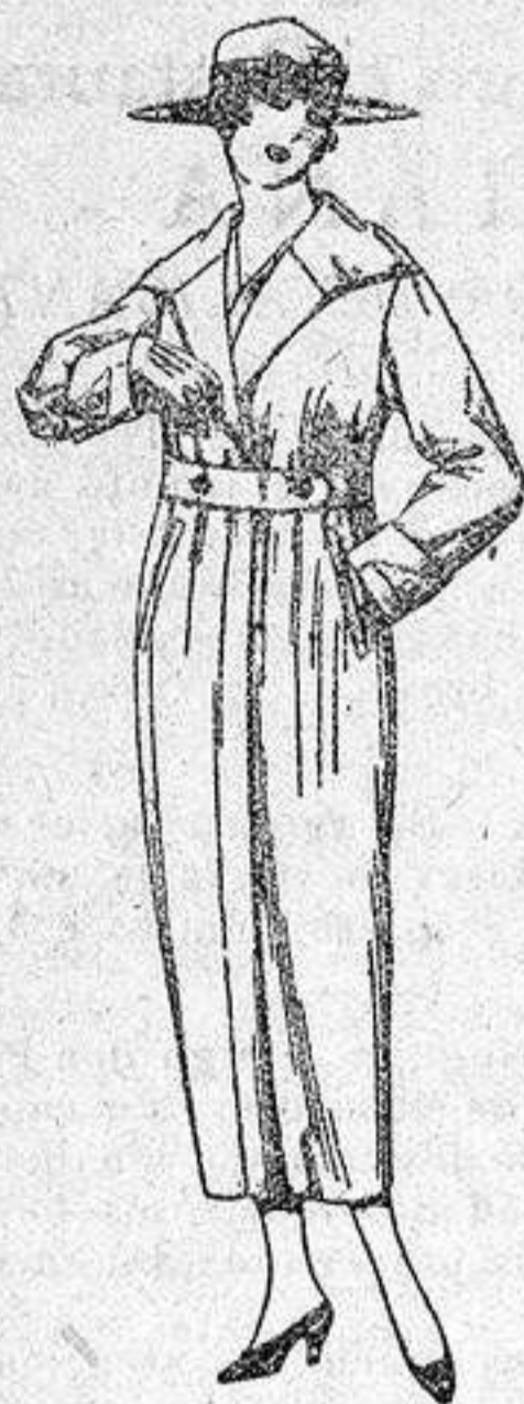
Guardapolvos de gabardilla, dril y alpaca, colores beige, kaki, gris, etcétera, de ptas. 22 a 55.

Ropas confeccionadas para Caballero, Señora, Niño y Niña