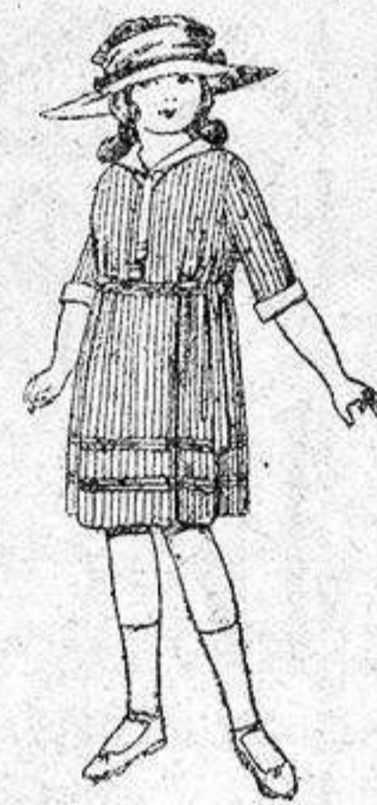
Vestidos de voile, listados, adornos blancos, para niñas de 4 a 9 años, de ptas. 22 a 32.