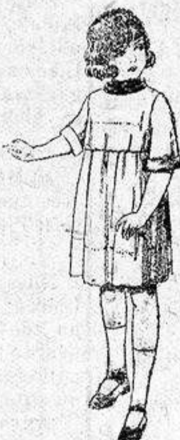
Vestidos de seda liberty, pongée, etc., para niñas de 7 a 12 años, de pesetas 30 a 38.