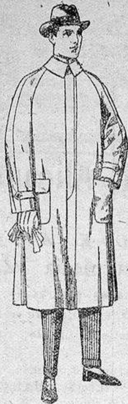
Impermeables, forma gabán, «Reglán», de pe setas 40 a 150

SUCURSALES: Madrid, Barcelona, Almería, Bilbao, Cádiz, Cartagena, Gijón, Granada, Málaga, Palma de Mallorca, Santander, Sevilla, Valencia, Valladolid y Zaragoza.