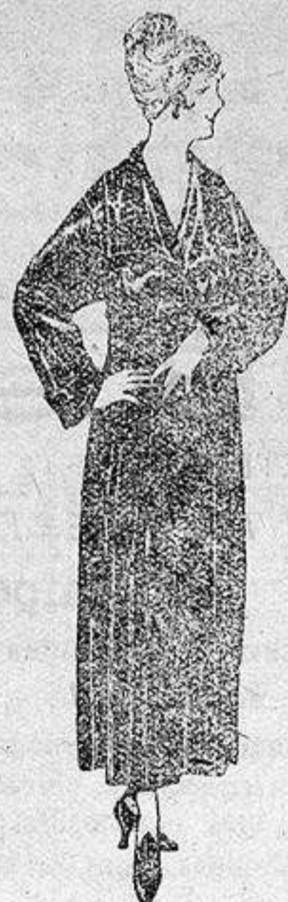
Batas de crepón, esterilla, etc., de ptas 32 a 46.