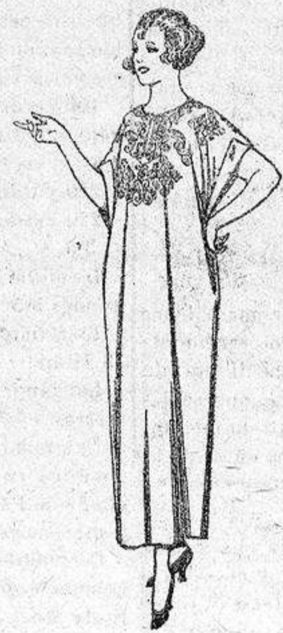
Batas de crepón, voile, etc., adornos bordados, de ptas. 14 a 22.