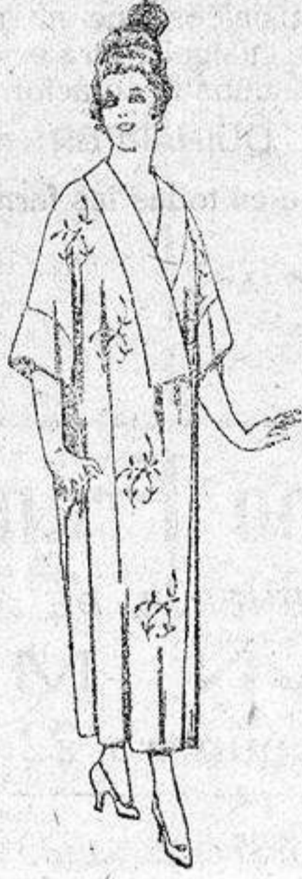
Batas de esterilla «Matting», adornos bordados, de pesetas 14 a 22.