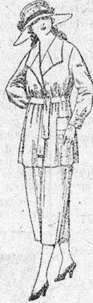
Trajes de estambre, gabardina, etc., en azul y color, de ptas. 68 a 79.