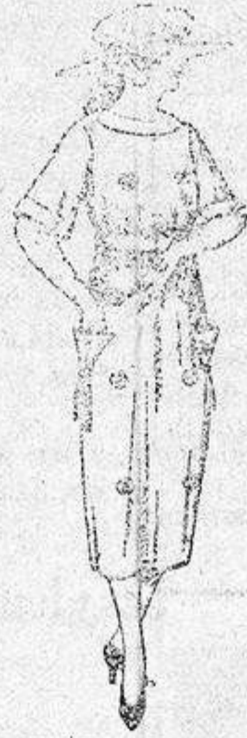
Vestidos de serga inglesa, estambre, etc., en azul y colores, adornos bordados, de ptas. 55 a 62.