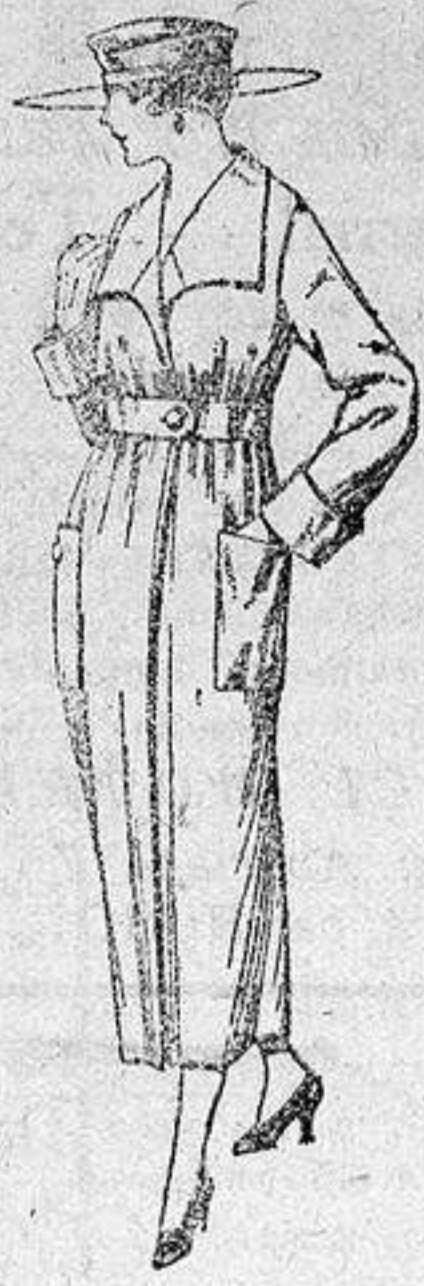
Guardapolvos de dril crudo, gris, etc., de ptas. 14 a 28.