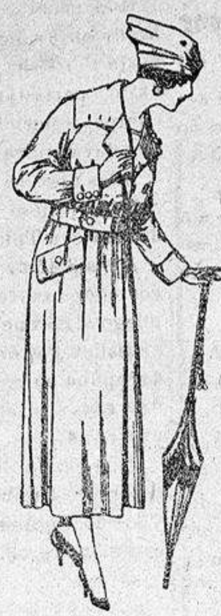
Abrigos de gabardina inglesa, impermeabilizados, diferentes colores, de ptas. 85 a 150.