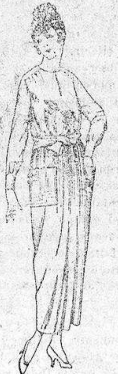
Busas de crepón, voile, etc., en negro, azul y color, adornos bordados, de ptas. 17 a 22. Falda de lanilla, estambre, gabardina, etc., en negro, azul y colores, de ptas. 28 a 36.