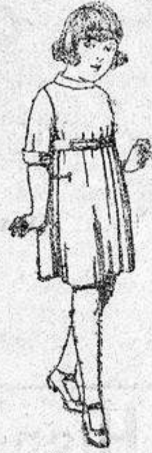
Vestidos de serga inglesa azul, y adornos serga blanco, para niñas de 4 a 9 años, de ptas. 36 a 40.