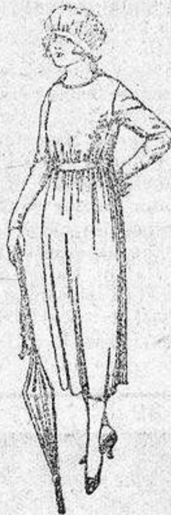
Vestidos de estambre, lanilla, etc., en azul y colores, adornos bordados, de ptas. 57 a 65.