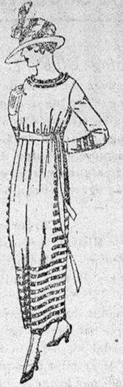
Vestidos de serga inglesa estambre, etc., en negro, azul y color, adornos tren cilla de seda, de ptas. 90 a 105.