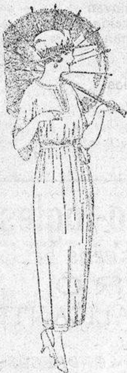
Vestidos de voile blanco y color, adornos bordados, de pesetas 45 a 58.