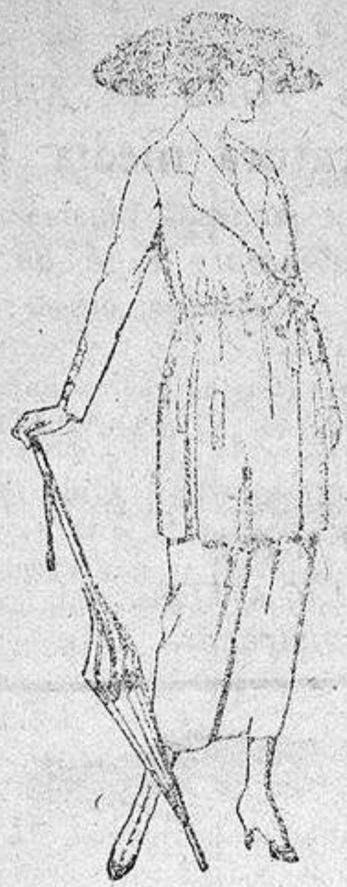
Trajes de estambre, lanilla, etc., en negro, azul y color, de ptas. 120 a 185.

SUCURSALES: Madrid, Barcelona, Almería, Bilbao, Cádiz, Cartagena, Gijón, Granada, Málaga, Palma de Mallorca, Santander, Sevilla, Valencia, Valladolid y Zaragoza.