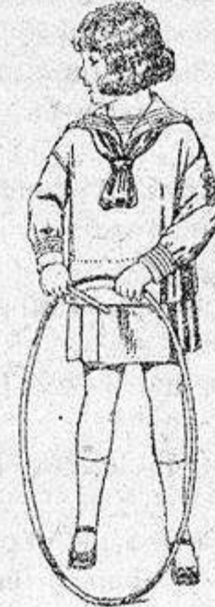
Trajes modelo «Marinera inglesa», de estambre o jerga azul, para niñas de 4 a 9 años de pesetas 30 a 42.