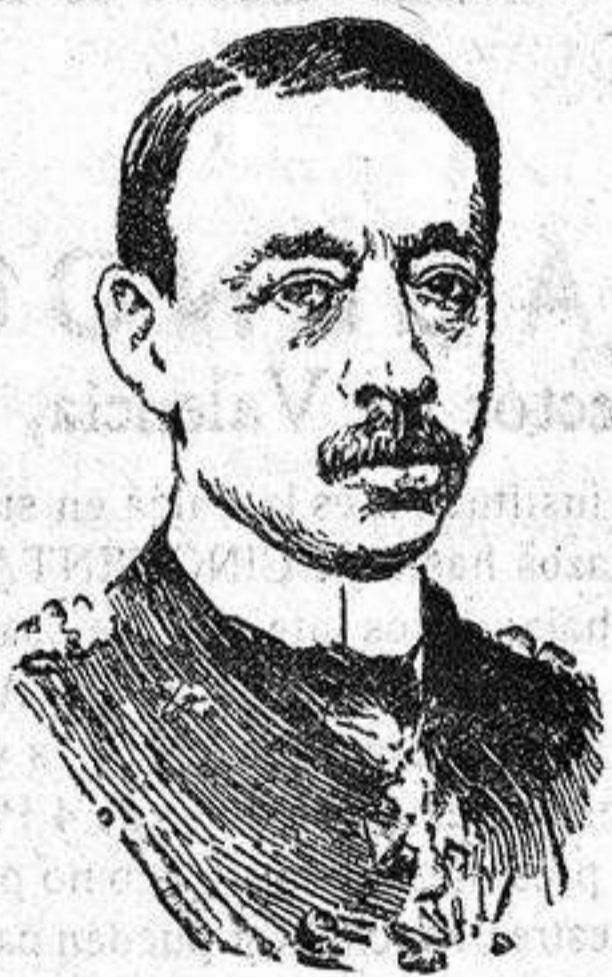
MR. ROBERT GANSING ministro de Negocios Extranjeros de los EE. UU. y delegado en las Conferencias de la paz