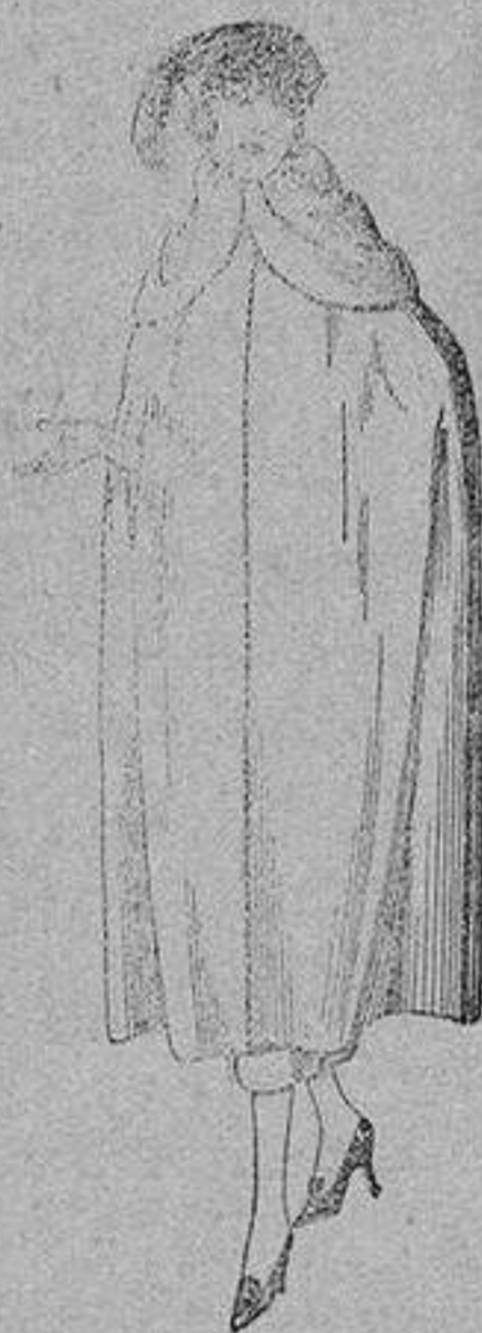
Capas de gabardina inglesa, diferentes colores, de ptas. 110 a 130.