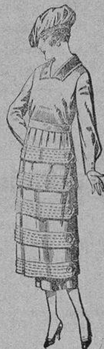
Vestidos de estambre, gabardina, sarga, etc., en negro, azul y color, pespunte y adorno, de ptas. 110 a 140.