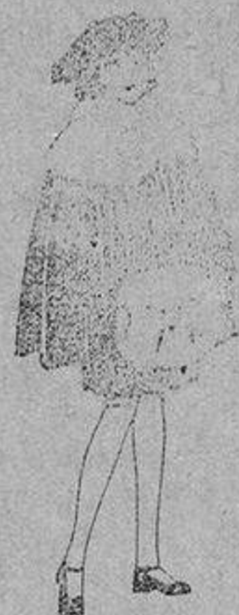
Juego de pieles blanco, imitación armiño, para niñas, de ptas. 16 a 21.