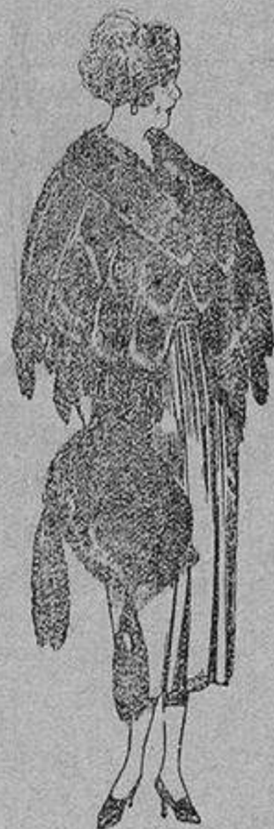
Juego pieles, imitación Renard negro, de pesetas 100 a 150.