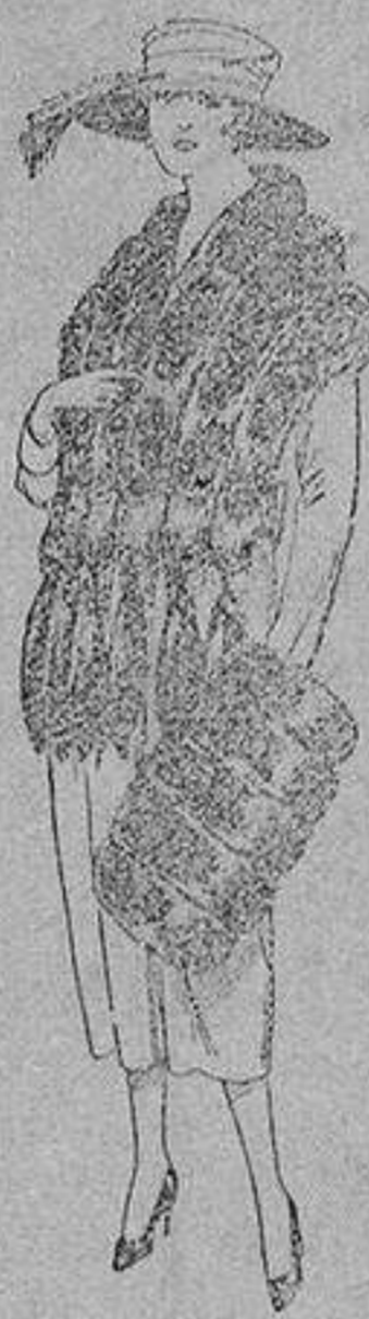
Juego de pieles, imitación "Colombia", negro de pesetas 40 a 100.