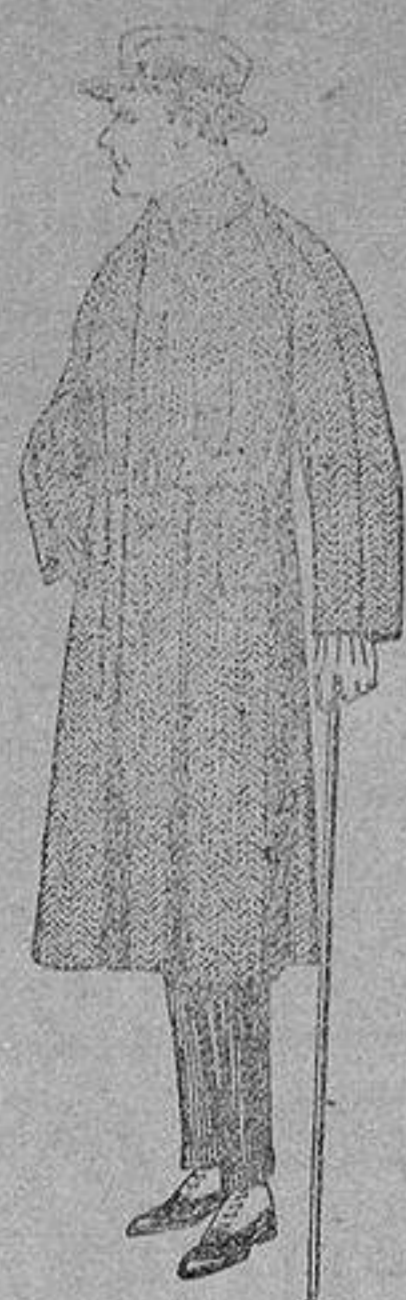
Trajes de punto de lana negro, azul y colores, a pras. 150 a 250. Gabanes de patén, chaviot o cover, de pesetas 85 a 136.