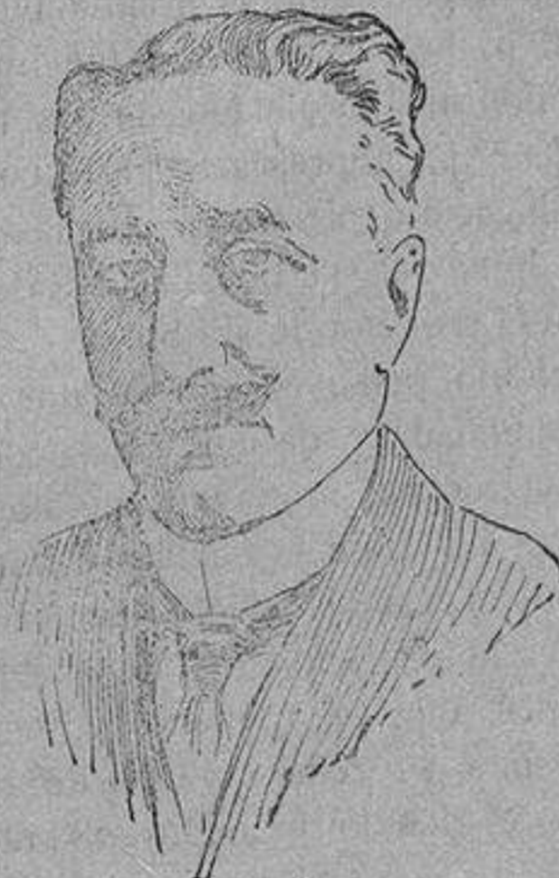
M. PAUL DESCHANDEL

que ha sido nombrado Presidente de la República Francesa