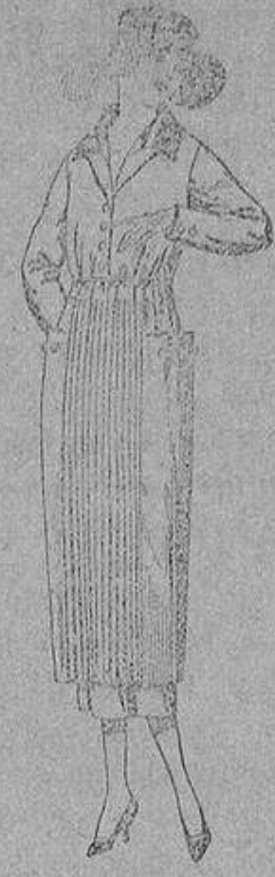
Vestidos de sarga in- glesa, estambre, etc., en negro, azul y color, adornos punto, de pe- setas 118 a 150.