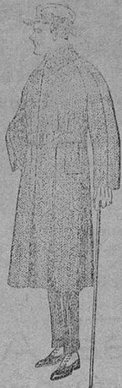
Trajes de punto de lana - Gabanes de patén, cha- negro, azul y colores, viot o cover, de pesetas 150 a 250. 85 a 136.