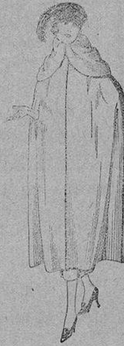
Capas de gabardina inglesa, diferentes co- lores, de ptas. 110 a 130.