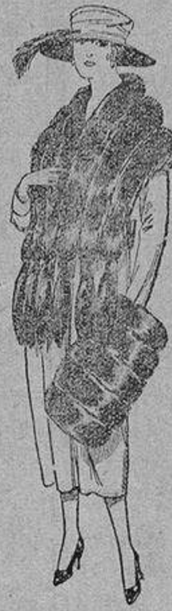
Juego de pieles, imitación «Colom- bia», negro de pe- setas 40 a 100.