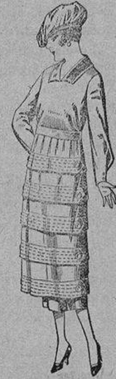
Vestidos de estam- bre, gabardina, sar- ga, etc., en negro, azul y color, pes- puntos y adorno, de ptas. 110 a 140.