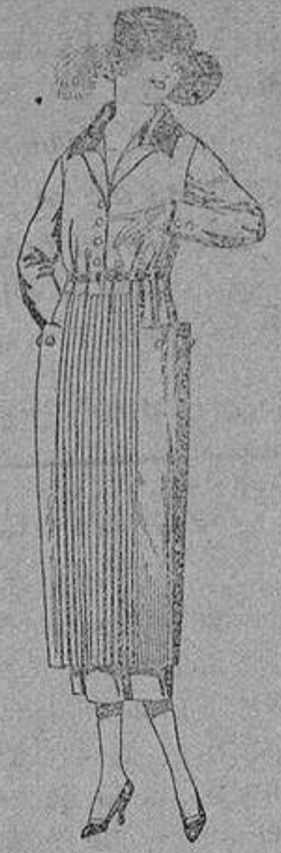
Vestidos de sarga inglesa, estambre, etc., en negro, azul y color, adornos punto, de pesetas 118 a 150.