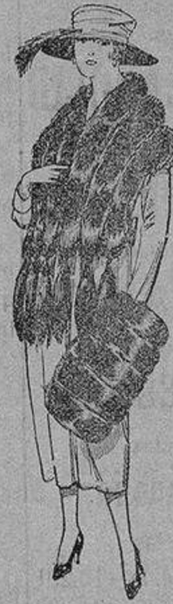
Juego de pieles, imitación «Colombia», negro de pesetas 40 a 100.