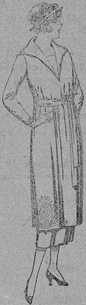
Vestidos de punto de lana azul y color, adornos bordados, de pesetas 149 a 250.