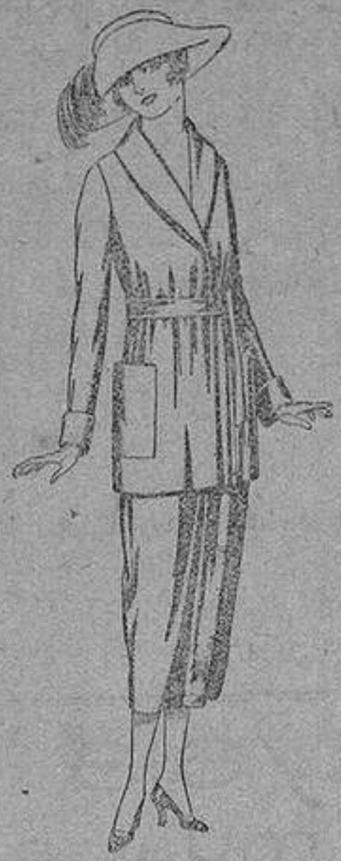
Trajes de punto de lana negro, azul y colores, de ptas. 150 a 250.

SUCURSALES: Madrid, Barcelona, Almería, Bilbao, Cádiz, Cartagena, Gijón, Granada, Málaga, Palma de Mallorca, Santander, Sevilla, Valencia, Valladolid y Zaragoza.