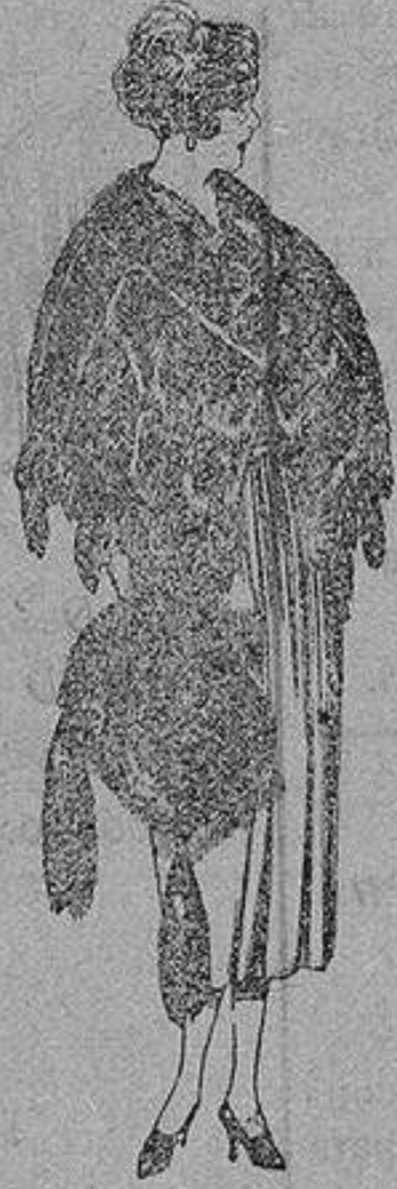
Juego pieles, imitación Renard negro, de pesetas 109 a 150.