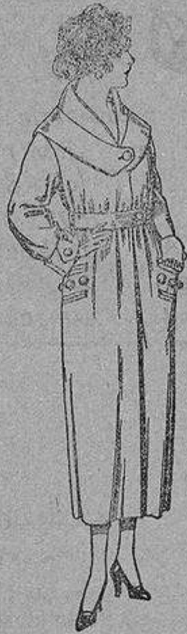
Abrigos de gamuza panfete, etc., en negro, azul y color, de ptas. 45 a 90