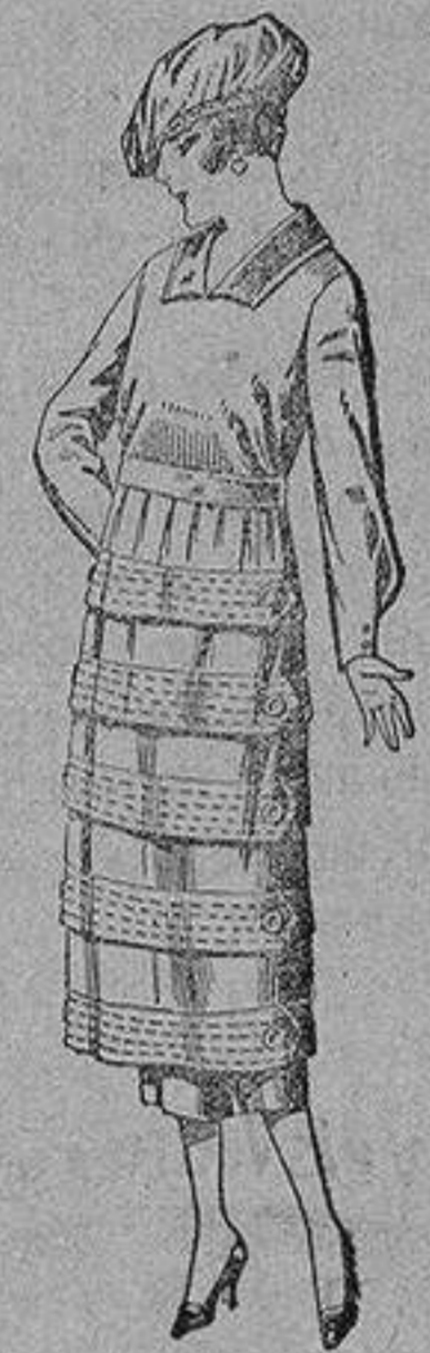
Vestidos de estambre, gabardina, sarga, etc., en negro, azul y color, pespunte y adorno, de ptas. 110 a 140.