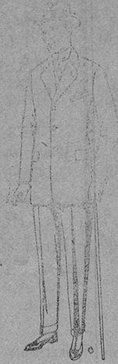
Trajes de chaviot con cinturón, elegante corte, para Sportman, de pesetas 53 a 125.