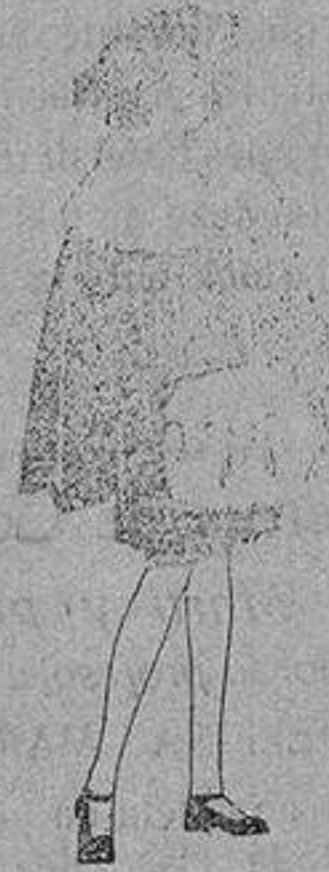
Juego de pieles blanco, imitación armiño, para niñas, de ptas. 16 a 21.