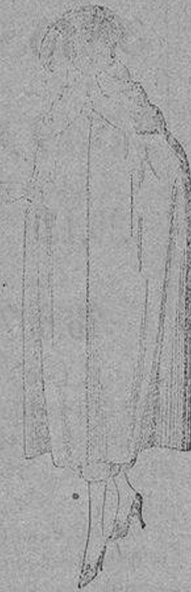
Capas de gabardina inglesa, diferentes colores, de ptas. 110 a 130.