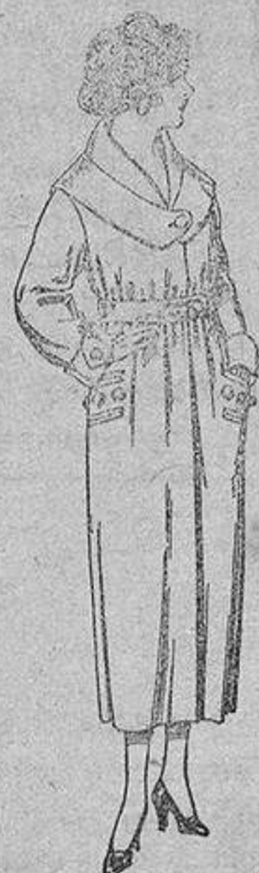
Vestidos de punto de lana azul y color, adornos bordados, de pesetas 140 a 250. Abrigos de gamuza pañete, etc., en negro, azul y color, de ptas. 45 a 90