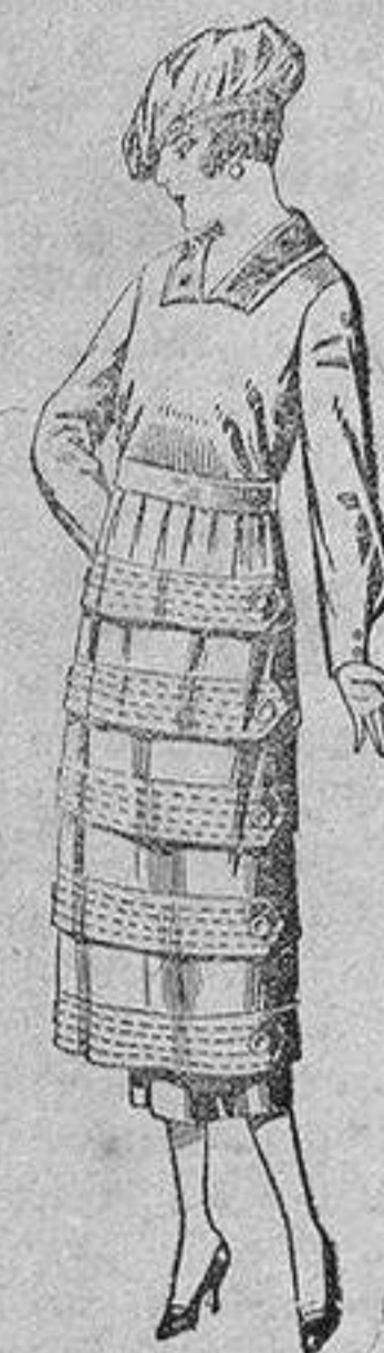
Vestidos de estambre, gabardina, sarga, etc., en negro, azul y color, pespunte y adorno, de ptas. 110 a 140.