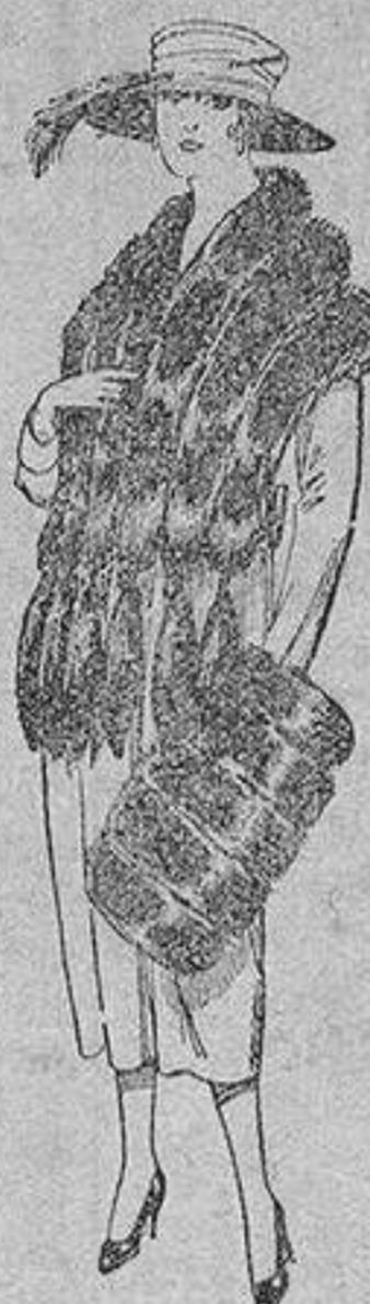
Juego de pieles, imitación «Colombia», negro de pesetas 40 a 100.