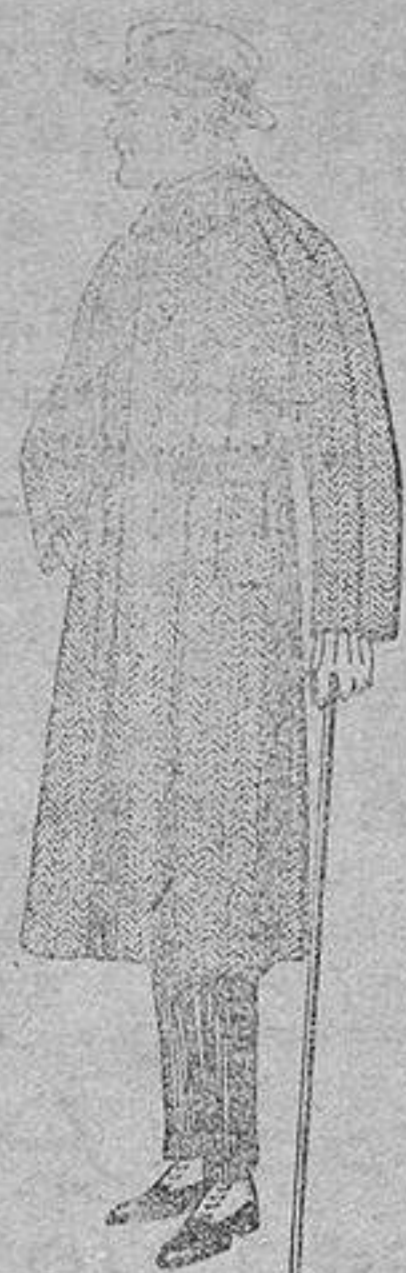
Trajes de punto de lana negro, azul y colores, de pesetas 150 a 250. Gabanes de patén, chaviot o cover, de pesetas 85 a 136.