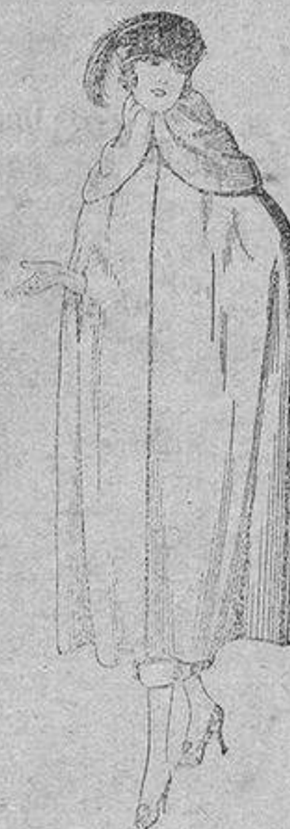
Capas de gabardina inglesa, diferentes colores, de ptas. 110 a 130.