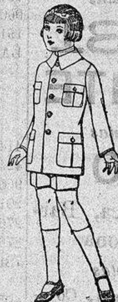
Trajes de patén, modelo sport, para niños de 4 a 9 años. De ptas. 23 a 35