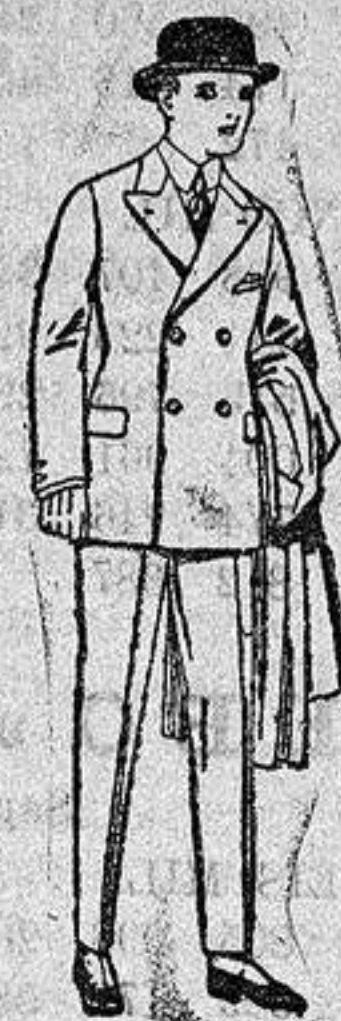
Trajes de patén, y vicuña etc. para niños y jovencitos de diez a dieciséis años. De ptas. 32 a 65

ULTIMA NOVEDAD en echarpes, manguitos, pelerinas, corbatas, abrigos etc. en pieles de lontre, taupe, visón renard, zibeline, armino, etcétera auténticos e imitación perfecta.