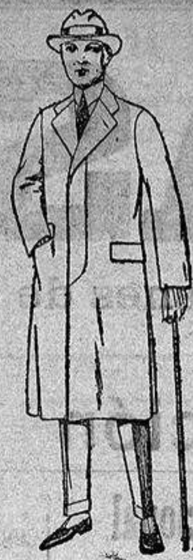
Gabanes de cheviot, gamuza patén etc. De ptas. 45 a 140.