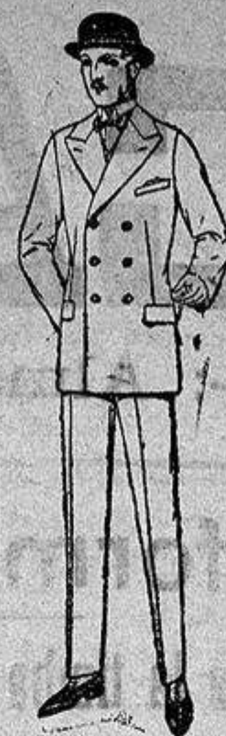
Trajes de melión, estambre, vicuña, jerga cheviot, etc. De ptas. 80 a 170

Ropas confeccionadas para caballero Señora Niño Niña