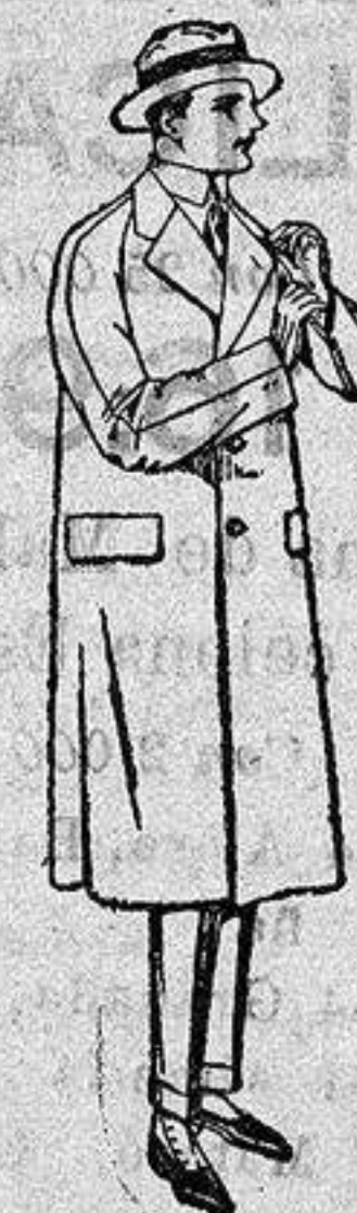
Gabardinas impermeabilizadas. De ptas. 127 a 190.