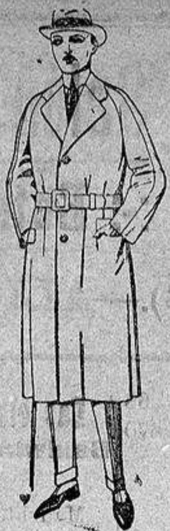
Gabanes forma ran-glán, de patén, gamuza o cower. De ptas. 60 a 200