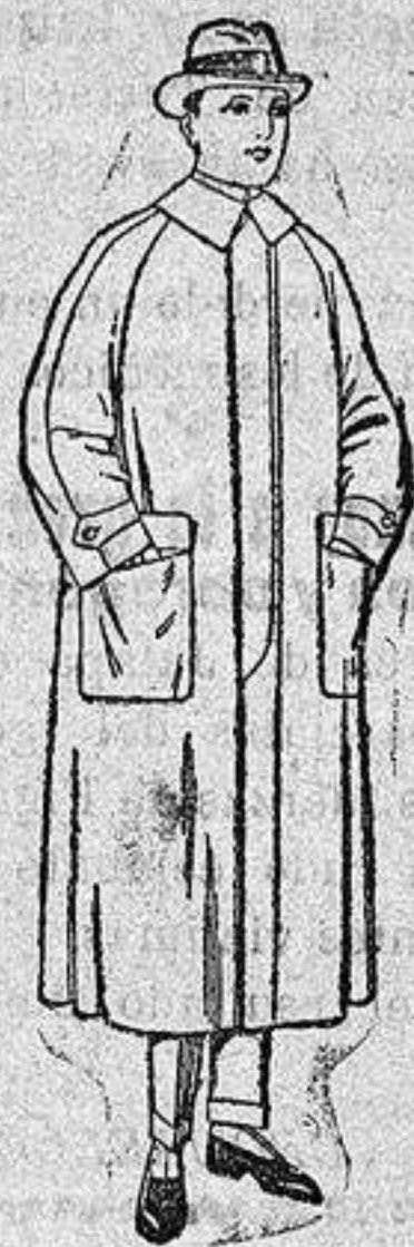
Impermeables raglán en azul y colores. De ptas. 32 a 170 Impermeables Mackferland, en negro y azul De ptas. 90 a 170