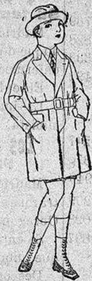
Gabanes de patén gamuza etc. para niños de 4 a 12 años. De ptas. 30 a 65.

Camisería, Géneros de punto, Corbatería Guantería, Sombrerería, Zapatería, Paraguas, Bastones y artículos de viaje