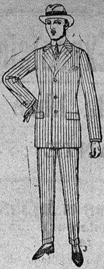
Trajes de melión, cheviot estambre, etc. De ptas. 38 a 157

Sucursales.—Madrid, Barcelona, Almeria, Bilbao, Cadiz, Cartagena, Gijón, Granada, Málaga, Palma de Mallorca, Santander, Sevilla, Valencia, Valladolid, Zaragoza