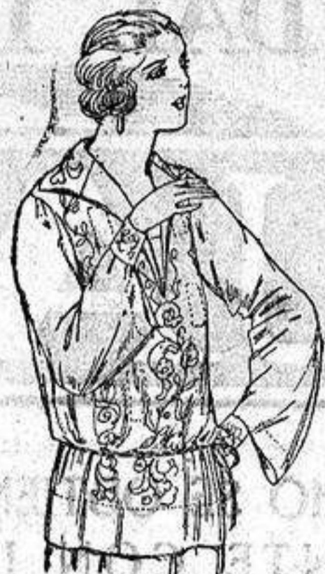
Brusas de voile de seda en negro y blanco adornos bordados. a ptas. 22.