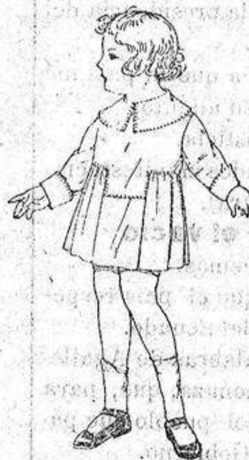
Ve tides batista blanca espuntes no para niñas de 3 años. de 5 50 a 6 50. ptas.

Ropas confeccionadas para Caballero, Señora Niño y Niña