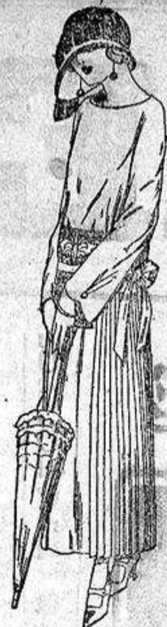
Vestidos de sarga inglesa, popelina, etc. en negro, azul y color, adornos bordados a ptas. 110.