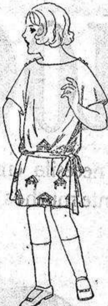
Vestidos popelina sarga inglesa etc. adornos bordados para niños de 4 a 9 años. de ptas 30 a 35.

Ropas confeccionadas para Caballero, Señora Niño y Niña