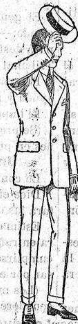
Trajes modelo Spotr, de lanilla; melton etc. de ptas. 75 a 10