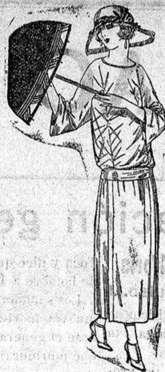
Vestidos de tricot de seda, en negro, azul y colores moda, adornos bordados. a ptas. 115