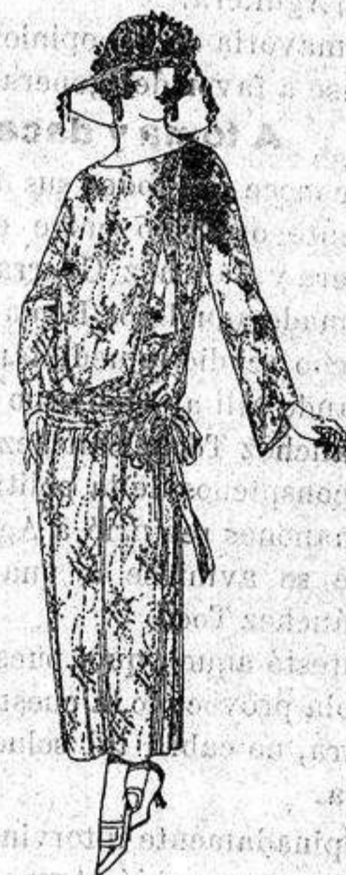
Vestidos de velo de algodón, dibujos nov edad. a ptas. 50

Boas, Camisería, Géneros de punto Corbatería, Guantería, Sombrería Zapatería, Paraguas, Bastones Sombrillas y Artículos de viaje