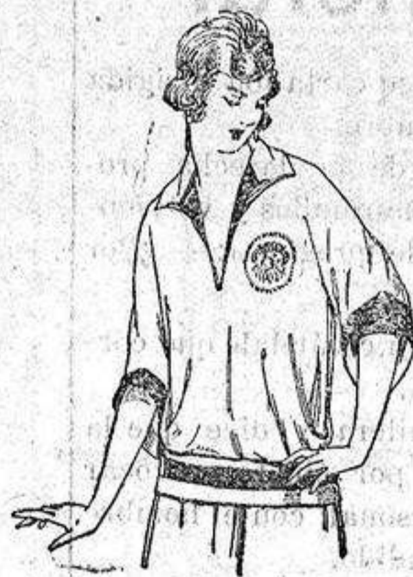
Blusas tricot de seda en negro y colores moda. a ptas. 39.