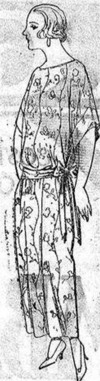
Batas de crespón, en negro y colores, adornos bordados. de ptas. 32 a 33