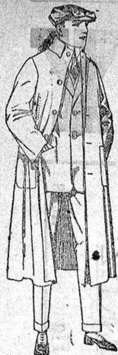
Guardapolvos de dril, igual al modelo. de ptas. 12 a 20.

Sucursales: Madrid, Barcelona, Almeria, Bilbao, Cadiz, Cartagena, Gijón, Granada, Málaga, Palma de Mallorca, Santander, Sevilla, Valencia, Valladolid, Zaragoza