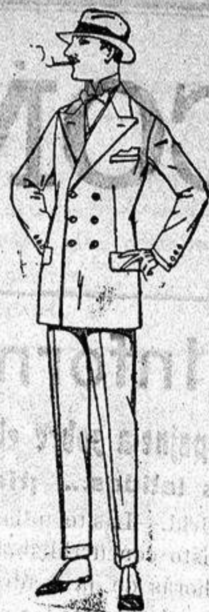
Trajes de lanilla, melton estambre vicuña o jerga. de ptas. 40 a 140.