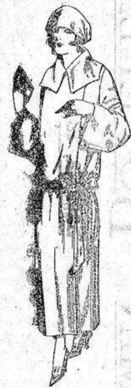
Guardapolvos de dril, crudo, gris, b.ig. etc. de ptas. 18 a 25.