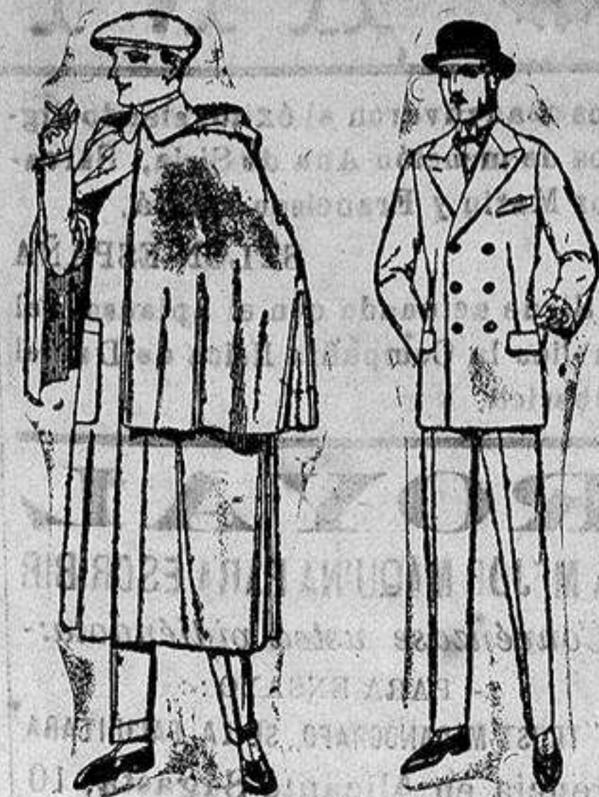
Impermeables mack- ferland en negro y azul de ptas. 85 a 157