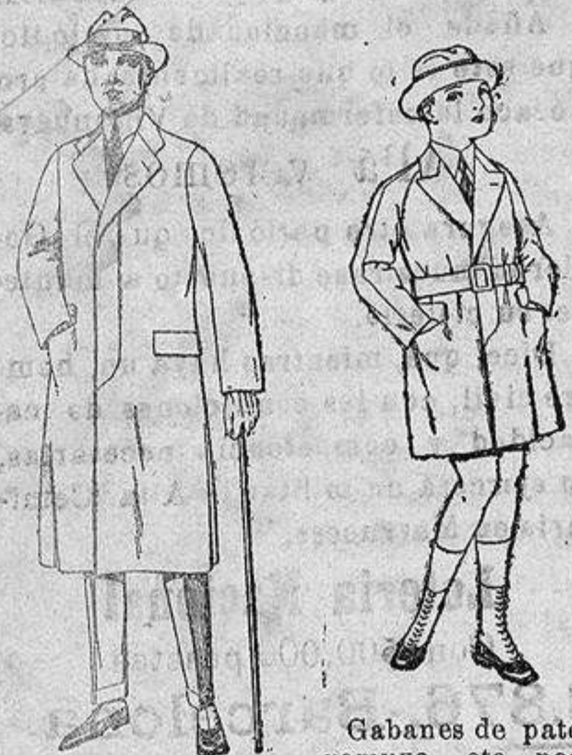
Gabanes de cheviot, gamusa o patén etcétera. de ptas. 45 a 140