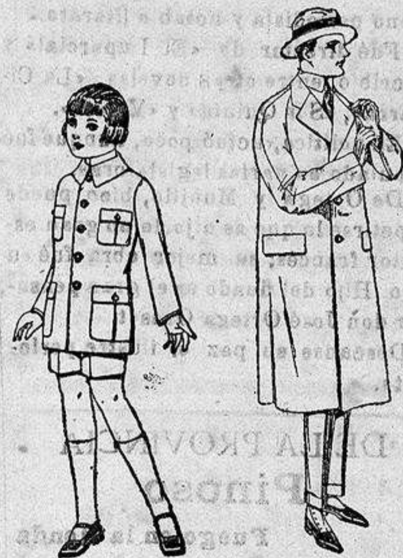
Trajes de patén modelo Sport, para niños de 4 a 9 años. de ptas. 22 a 35.