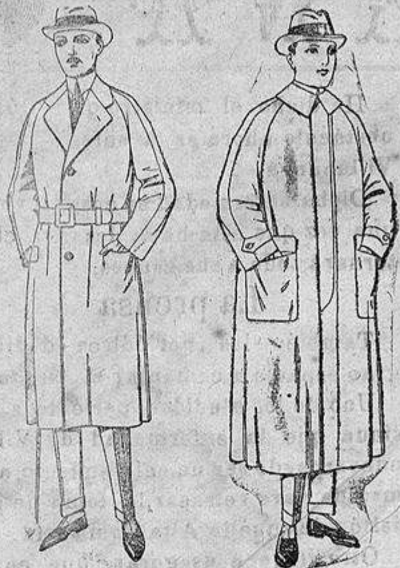
Gabanes raglánd de patén, gamusa o color. de ptas. 75 a 200

Sucursales: Madrid, Barcelona, Almeria, Bilbao, Cadiz, Cartagena, Gijón, Granada, Málaga, Palma de Mallorca, Santander, Sevilla, Valencia, Valladolid, Zaragoza