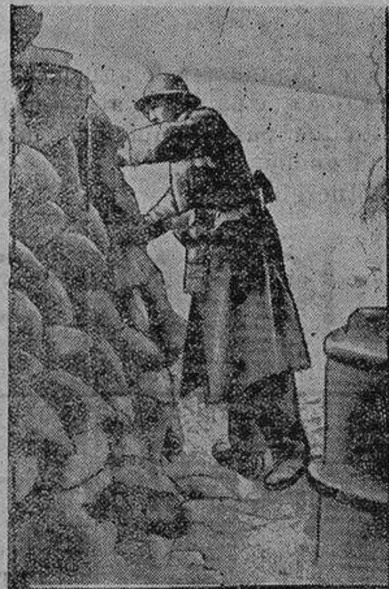
Vigía en un parapeto

para tratar de forzar el paso de las lagunas y llegar detrás de la línea del Sereth y hasta la del Pruth. Alrededor de Tulcea la artillería alemana encuentra posiciones en que demoran el camino de Tulcea-Isma; pero entre estas dos ciudades hay 20 kilómetros, que es una distancia bastante grande para realizar una acción eficaz contra las baterías rusas que defienden la orilla Norte del río.