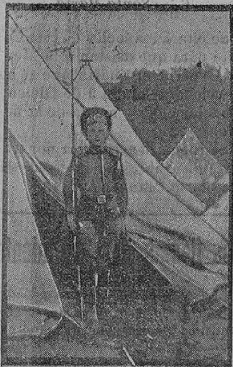
El ahijado de un regimiento serbio

Obsérvese que nuestro periódico jamás fué dade á la adulación y al elogio vacío; pero sabemos hacer justicia seca.