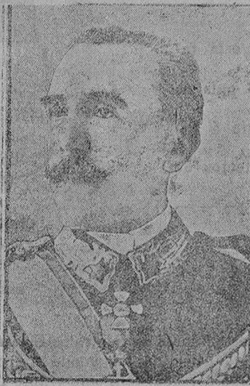
El general Forro