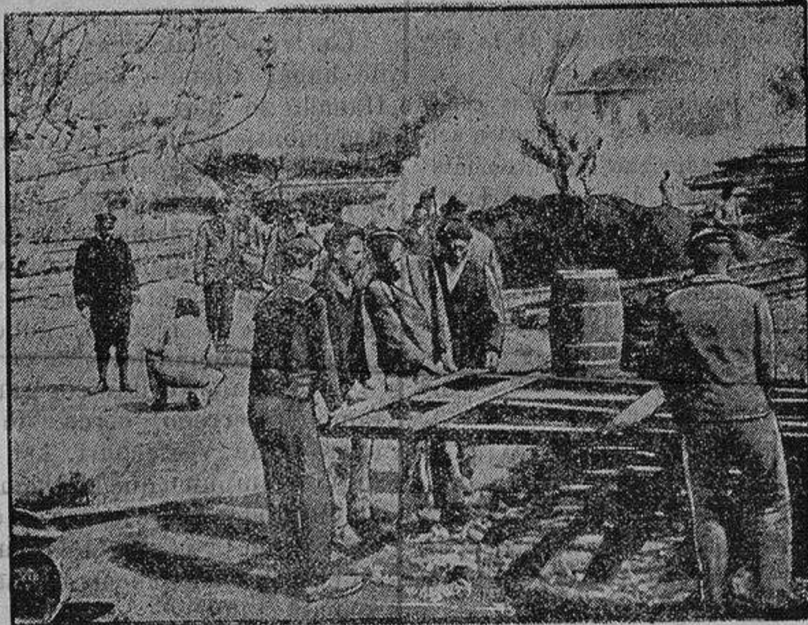
Instalación de hilos telefónicos por marinos franceses