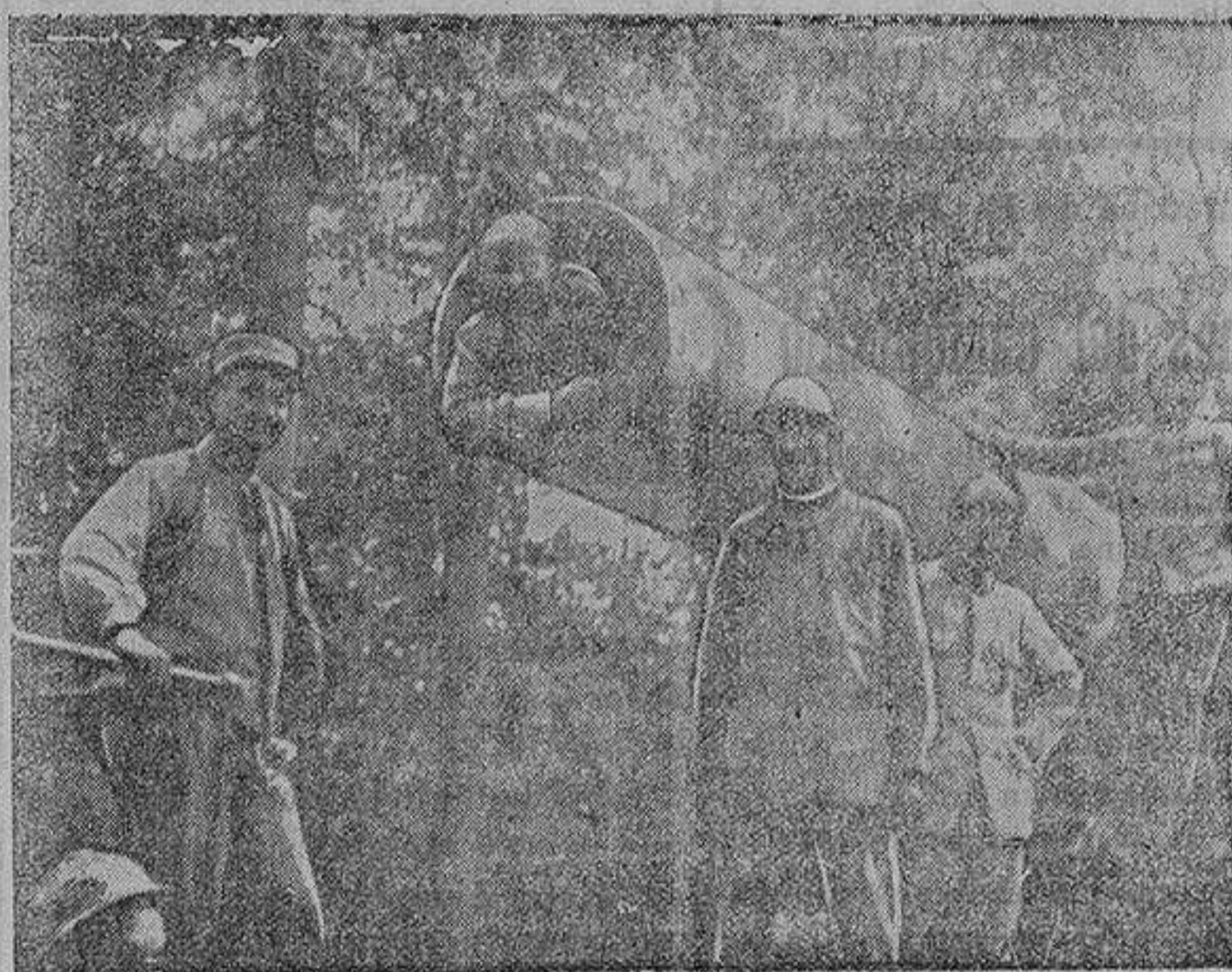
En la boca del monstruo

Sus aventuras tienen por base la pederastia y el amorío; los dos capítulos más importantes de su historia. El amor verdadero es desconocido para él; la mujer es uno de sus pasatiempos y el reto