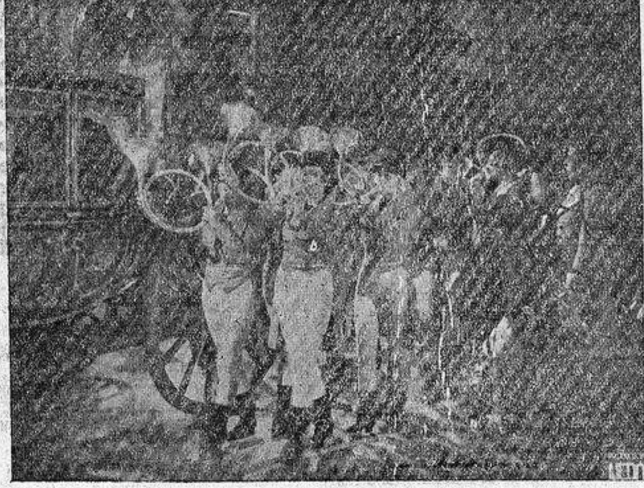
Se acabó la crisis