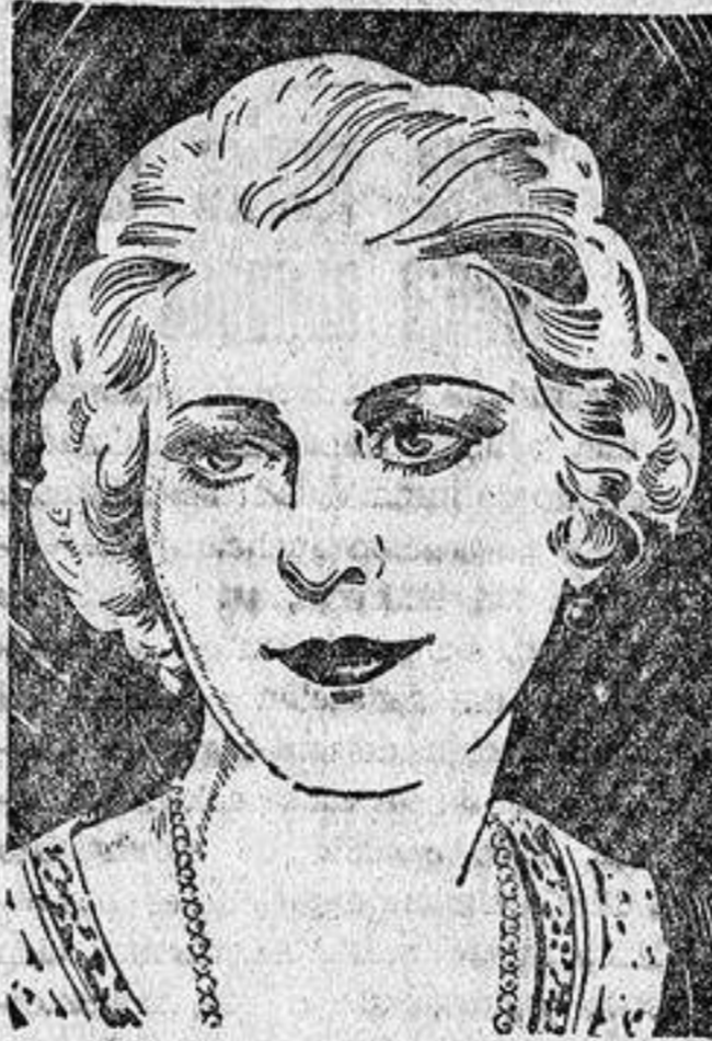
«En dos meses desaparecieron todas las arrugas»

«A mi edad, era natural que tuviese arrugas en la cara, y esta idea me consolaba con frecuencia. Un día no obstante, lei que se habían practicado notables experiencias, en mujeres de 72 años, con un nuevo alimento de la Piel, y que esas experiencias obtuvieron resultados asombrosos. Se afirmaba que las arrugas habían desaparecido por completo en 6 semanas. Me decidí a practicar la prueba en mi misma y encontré que este nuevo descubrimiento estaba contenido en la Crema Tokalon, Alimento de la piel. Después de dos semanas, pude notar una mejoría, y nadie podrá imaginar mi alegría cuando, después de dos meses de tratamiento, todas mis arrugas habían desaparecido. Mis amigas me decían: «¡Qué joven parece usted!» Ahora tengo la piel clara y deliciosamente aterciopelada; por lo tanto, aconsejo a todas las mujeres de mi edad que prueben la Crema Tokalon, Alimento de la Piel. Es un maravilloso tónico moral el verse rejuvenecer la cara de día en día.»