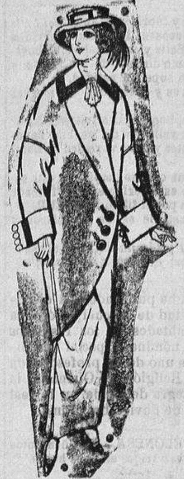
Abrigos de patén para señora De ptas. 5 a 65

Madrid, Barcelona, Almeria, Bilbao, Cádiz, Cartagena, Gijón, Granada, Málaga, Palma de Mallorca, Santander, Sevilla, Valencia, Valladolid y Zaragoza.