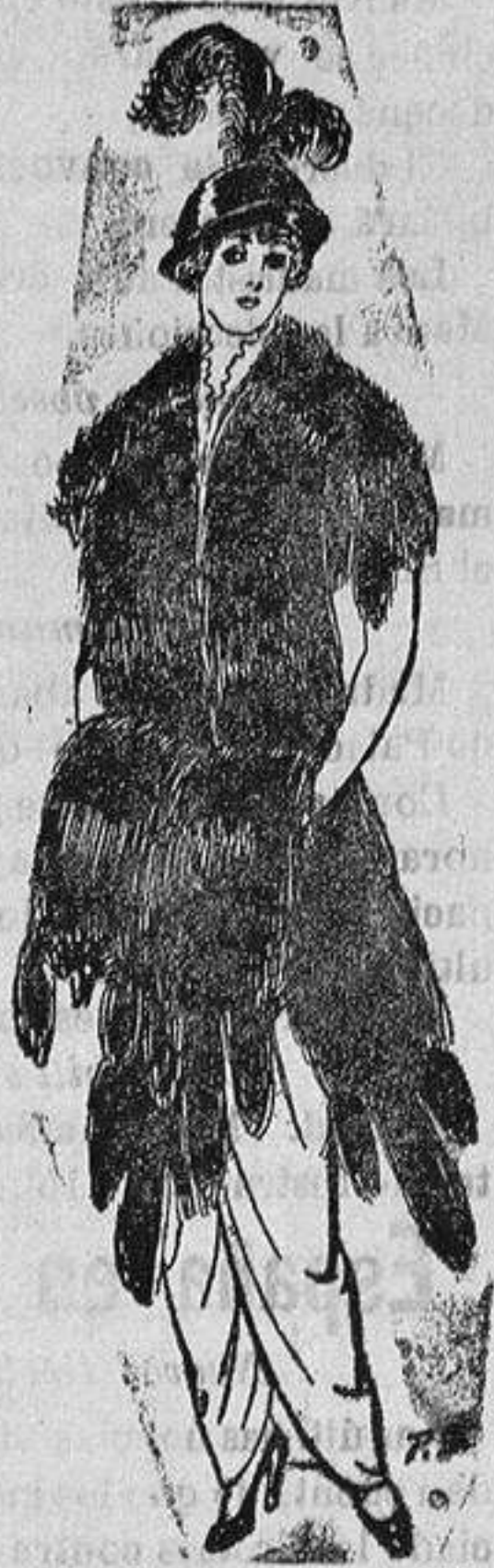
Juego de pieles imitación de Renard negro. De Ptas. 48 a 75