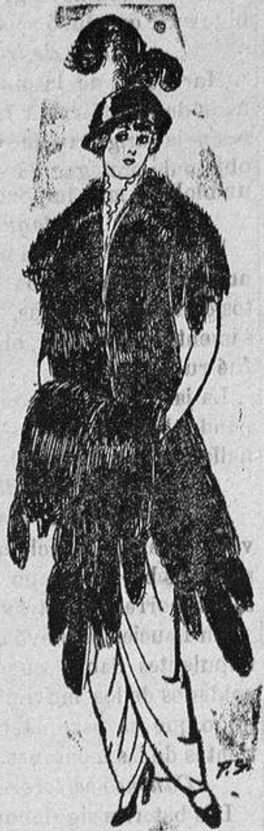
Juego de pieles imitación de Renard negro. De Ptas. 43 a 75