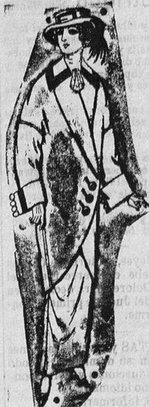
Abrigos de patén para señora De ptas. 5 a 65