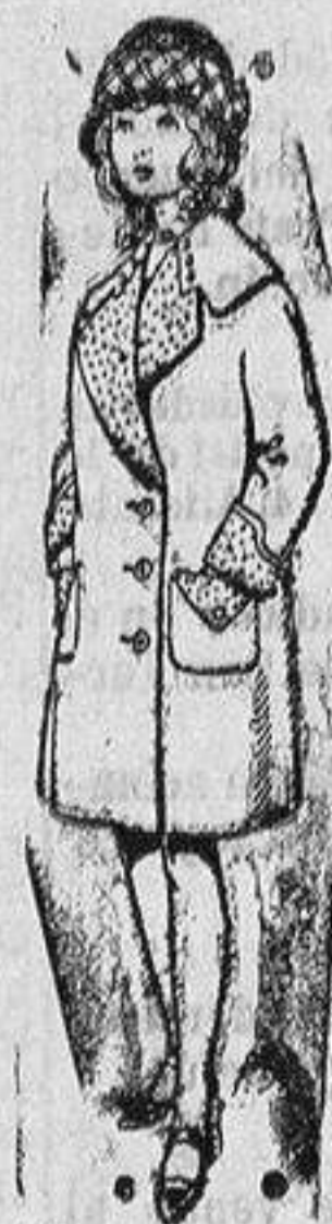
Abrigos para niñas de 4 a 12 años De pts. 15 a 24

Ropas confeccionadas para Caballeros y Niño y Artículos de la Temporada Confecciones de todas clases para SEÑORA y NIÑA