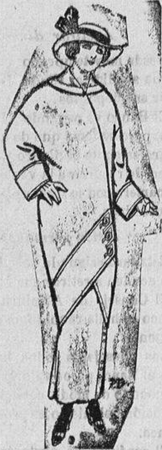
Abrigos de pañen para jovencitos de 14 a 16 años De Ptas. 18 a 26

Madrid, Barcelona, Almeria, Bilbao, Cádiz, Cartagena, Gijón, Granada, Málaga, Palma de Mallorca, Santander, Sevilla, Valencia, Valladolid y Zaragoza.